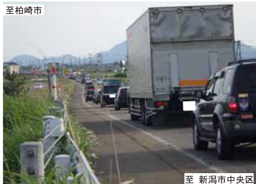
慢性的に渋滞する国道116号（田島地区）

新潟西道路の整備により、新潟都市圏東西軸の渋滞を緩和し、信頼性の高いネットワークを構築します。また、当該区間の渋滞緩和により、生活道路への抜け道利用が減少し、沿線地域の安全性向上が期待されます。