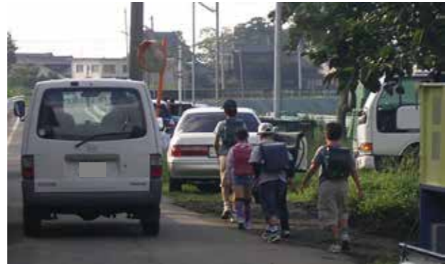
通学路を通過する車両