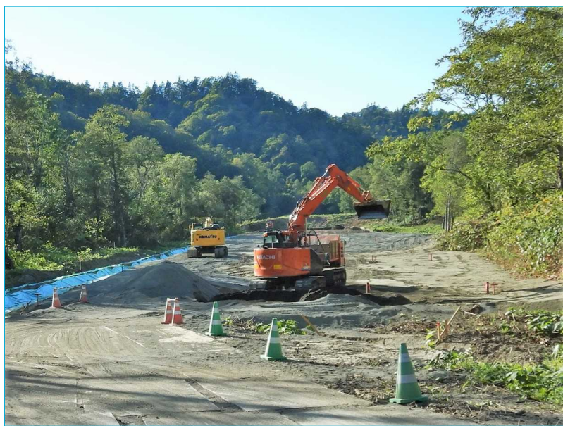
【盛土工 施工状況(令和4年9月)】