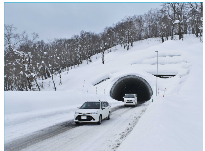
【霧立峠トンネル 開通状況(令和5年1月)】