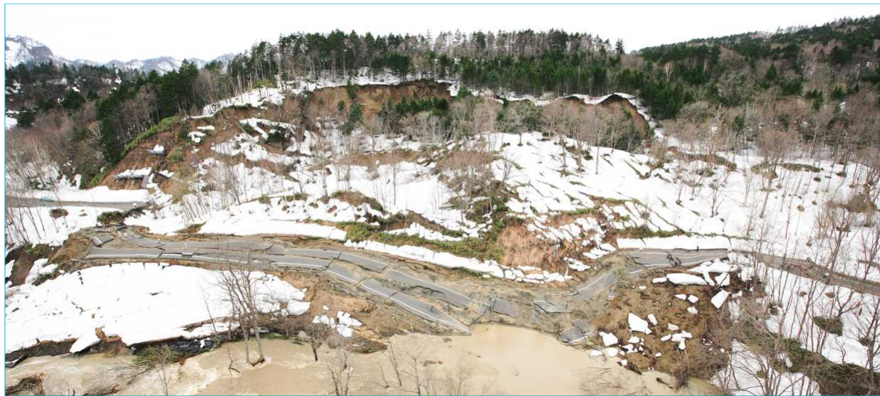
【地すべり被災状況(平成24年4月)】