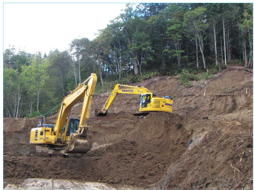
【(仮称)苦前トンネル坑口部切土工 施工状況(令和4年10月)】