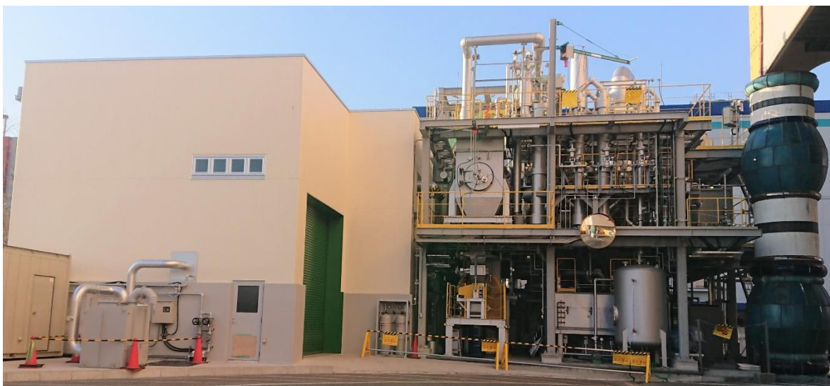
次世代型廃棄物処理システム 実証プラント