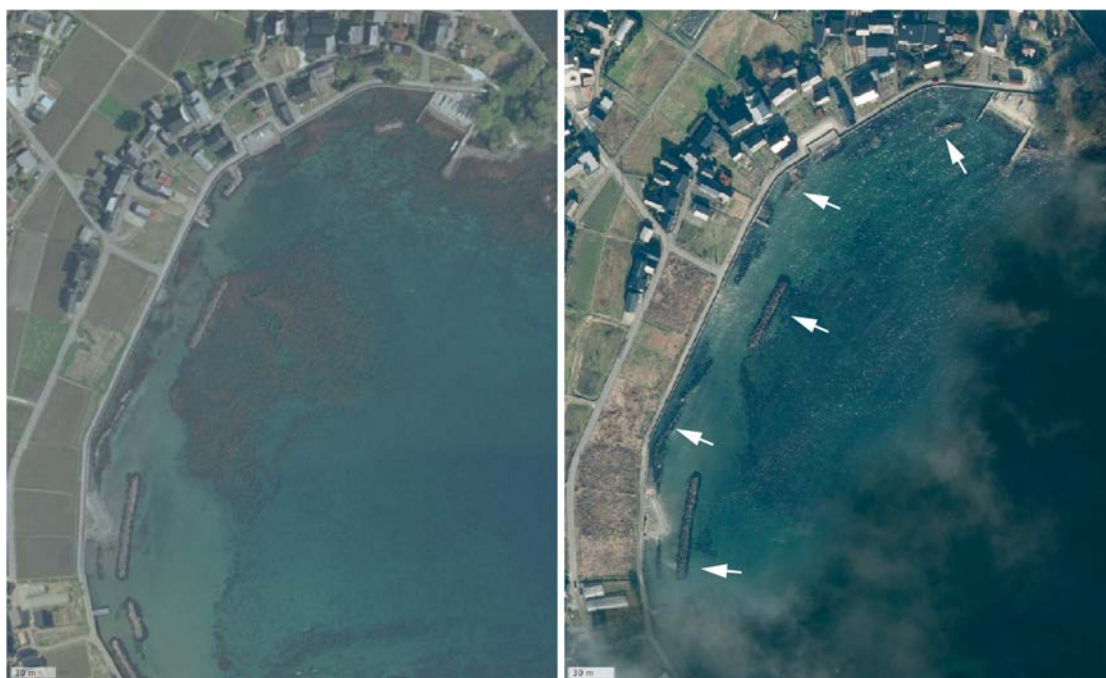
図4 沈降した可能性ある場所の写真（穴水町甲地区）

左の写真は地震前の空中写真（2010年5月8日撮影）。右の空中写真（2024年1月11日撮影）の青色の範囲は地震によって新たに「陸化」したエリアを示す。いずれも地理院地図による。