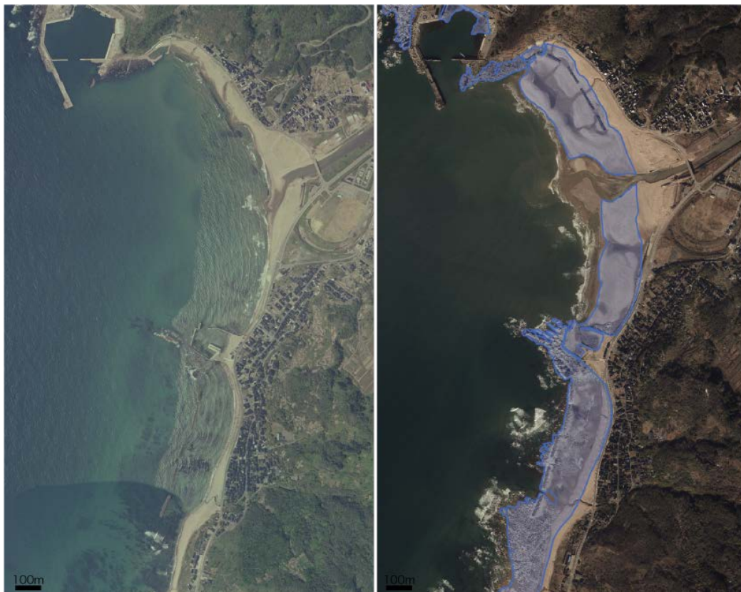
図3 判読結果の表示例（輪島市門前町黒島町）

左の写真は地震前の空中写真（2010年5月8日撮影）。右の空中写真（2024年1月11日撮影）の青色の範囲は地震によって新たに「陸化」したエリアを示す。いずれも地理院地図による。