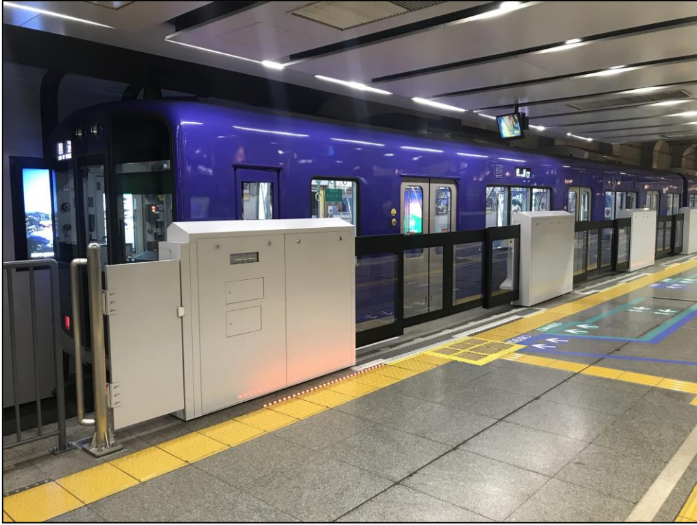
< 1番線・3番線ホームの可動式ホーム柵 >

(注) 2番線ホーム(2022年春頃完成予定)は、昇降ロープ式ホーム柵を設置します。