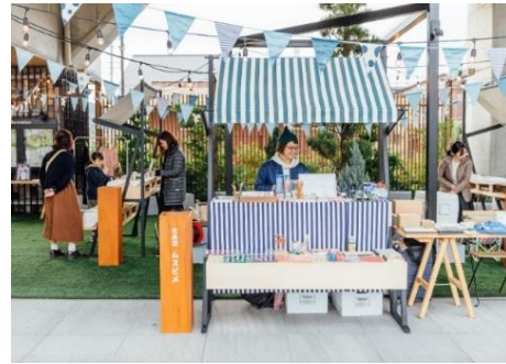
「トートひろば」のイメージ