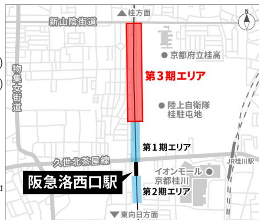
「TauT 阪急洛西口」開発エリアの位置図