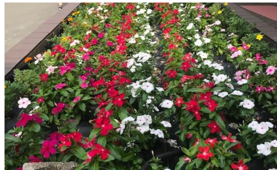
「コミュニティ花壇」のイメージ