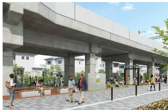
第3期エリアの外観イメージ

阪急電鉄は、京都市と連携しながら開発を進めている「TauT 阪急洛西口」において、第3期エリアに出店する5つのテナントを決定しましたので、お知らせします。