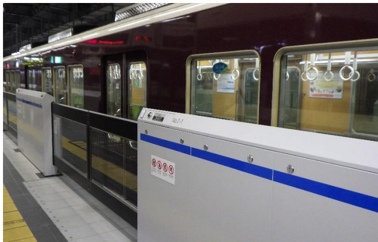
可動式ホーム柵(神戸三宮駅2番ホーム)

※当社十三駅に設置している可動式ホーム柵よりも約100mm薄型化を行い、お客様がより安全・快適にホームをご利用いただけるよう、できる限りホーム幅を確保するようにします。