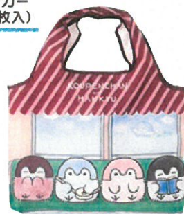
折りたたみエコバッグ ¥1,800