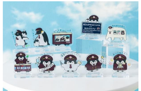
ブラインドアクリルスタンド(全10種) 各550円