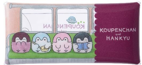
クリアマルチケース 800円