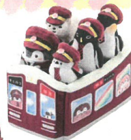
ぶちマスコットセット ¥5,000