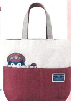
ランチ トートバッグ ¥2,200

*画像はイメージです。*価格は税込表記です。*店舗ごとに先入れ次第終了となります。あらかじめご了承ください。*販売店舗や、各店舗の営業状況は予告なく変更となる場合がございます。