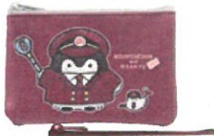
ミニポーチセット ¥1,100