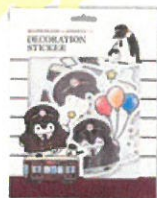
デコステッカー セット(12枚入) ¥850