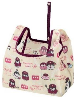
コンビニサイズ エコバック 1,400円