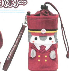
ぬいぐるみ ペットボトルホルダー ¥1,800