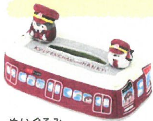
ぬいぐるみ ティッシュカバー ¥2,650