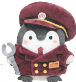
もちっとぬいぐるみS ¥2,000