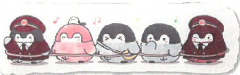
ゆるカットクッション ¥2,000