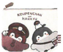
刺繍フラットポーチ ¥1,800