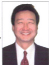
福一不動産 代表取締役