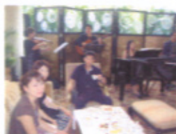
↑シンガポール社員旅行にて

弊社の強みは、福岡から発着している東南アジア方面の航空会社のチケットを、タイムリーな価格でご提供できることです。最近ではツアーを利用せずに個人旅行をされる方が増えていますので、個人のお客様にチケットを発券することも多くなっています。お客様の中にはホテルにもこだわりたいという方が多いので、弊社が今まで築きあげた人脈を駆使し、個人のお客様にチケットとホテルのバックも企画しています。