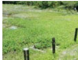
ミズゴケの堆積およびミツガシワの繁茂