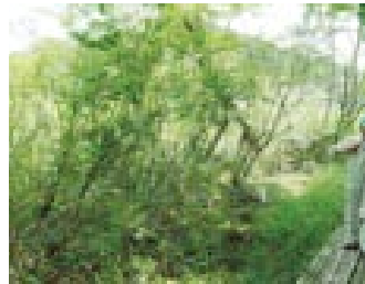
かつての開放水面が低木林化