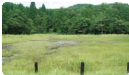
ミズゴケ等の堆積により陸化が進行