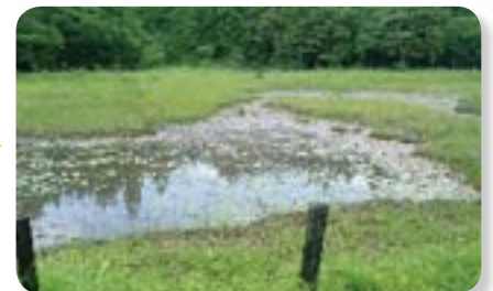
開放水面の拡大により多様な植生が回復