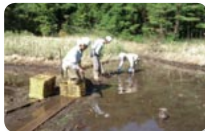
浚渫および植生の抜き取りを実施