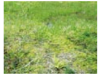
ミズゴケの堆積による陸化