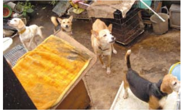
劣悪な環境に置かれた犬たちは、ストレスで吠えるなどの異常行動を示します。このような場所に飼えなくなった犬や猫を置いていく人も同罪といえるでしょう

安易に数を増やした結果、飼い主の経済力や世話がおいつかないため、犬や猫は十分な食餌も水も与えられず、糞尿の掃除も行き届かない劣悪な環境の中に閉じ込められます。このように世話を怠って犬や猫を苦しめるのは虐待です*1*2。人との温かいふれあいもなく、体も心も不健康な状態に置かれた犬や猫は健康状態も悪く、社会性もなく、人に慣れていないため、飼い主の生活が破綻し行き場を失ったとき、新しい飼い主をみつけるのは困難を極めます。自治体や動物愛護団体などが協力して新しい飼い主をさがす努力をしますが、全てに温かな家が見つかるとは限りません。