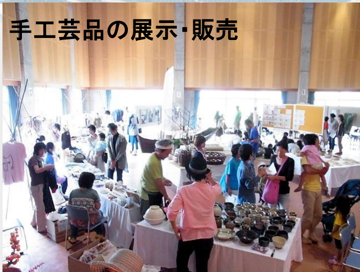
手工芸品の展示・販売