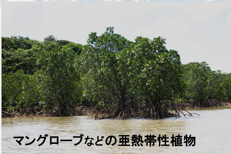
マングローブなどの亜熱帯性植物