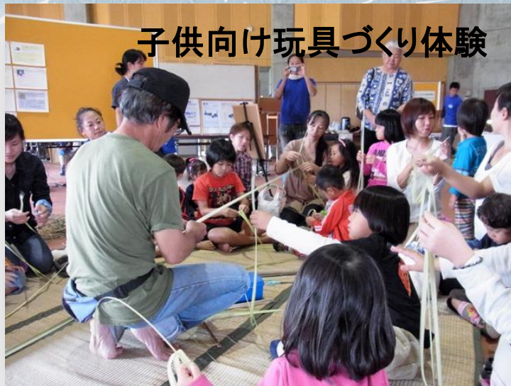
子供向け玩具づくり体験