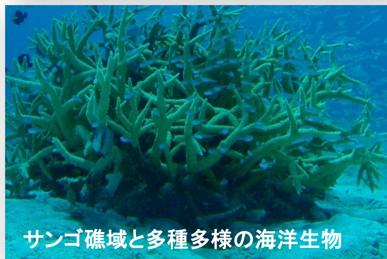
サンゴ礁域と多種多様の海洋生物