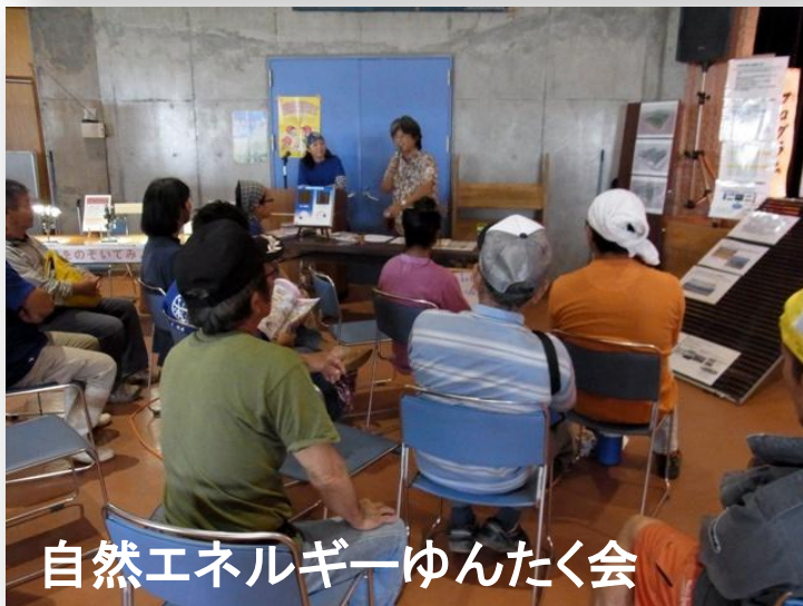
自然エネルギーゆんたく会