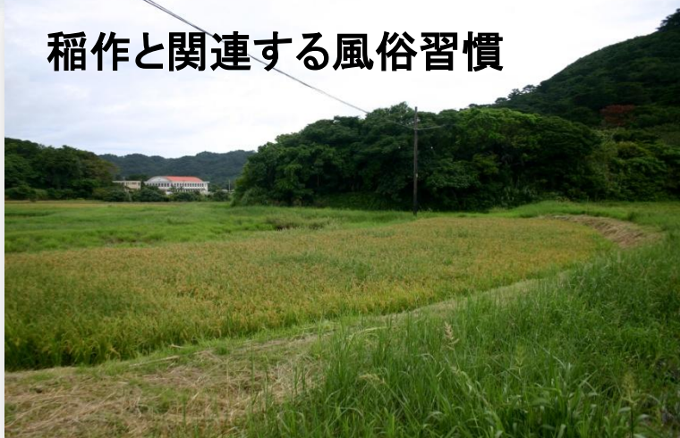
稲作と関連する風俗習慣