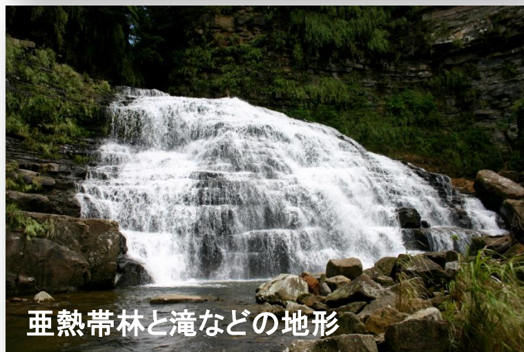
亜熱帯林と滝などの地形