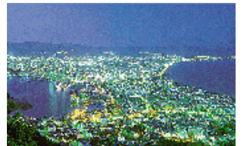
函館山からの夜景

様々な史跡・観光地・景勝地に恵まれ、特に函館山からの夜景は、世界三大夜景の一つともされ、年間200万人を越える観光客が訪れています。