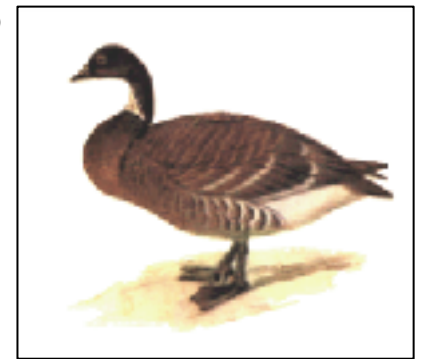
函館湾に飛来するコクガン

函館山は軍の要塞として過去半世紀に渡り立ち入りが禁止されていたため、自然状態は比較的良く、600種以上の植物が生息しています。