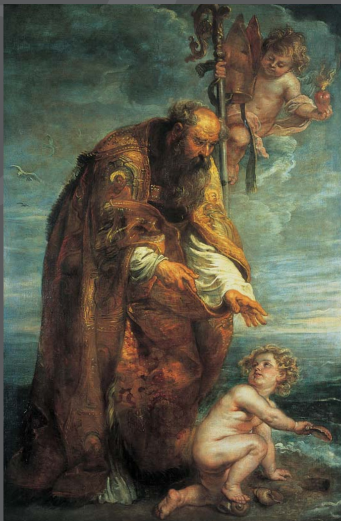
ピーテル・パウル・ルーベンス(聖アウグスティヌス)1636-1637年 油彩・キャンバス 232.0×153.0cm