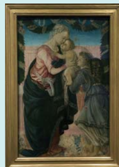
サンドロ・ボッティチエリ《聖母子と天使》1465～66年頃 ©Musée Fesch, Ajaccio. Photo : Jean-François Paccossi

フランス領コルシカ島アジャクシオ市にある、フェッシュ美術館の貴重なコレクションが、日本で初公開となります。皇帝ナポレオン一世の叔父フェッシュ枢機卿が愛したイタリア絵画とともに、卿に縁あるナポレオン関連絵画・彫刻などをご紹介します。