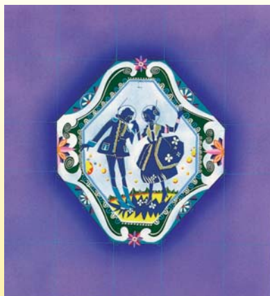
真鍋博《星新一「ようこそ地球さん」(新潮文庫)》1972年

愛媛出身のイラストレーター真鍋博という名とそのイラストを、星新一の作品とともに憶えている方も多い事でしょう。