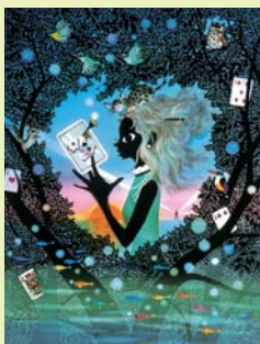
《アリスのハート》2005年 ©Seiji Fujishiro/HoriPro

光と影で表現する絵画「影絵」を芸術の域にまで高めた藤城清治の世界を紹介します。黒と鮮やかな色彩との美しいコントラスト、モダンでありながら、郷愁を誘う風景や風俗、童話の幻想的な作品をお楽しみください。