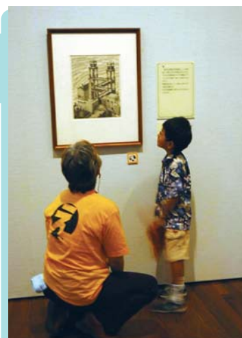
エッシャー展で「対話」に挑戦中!