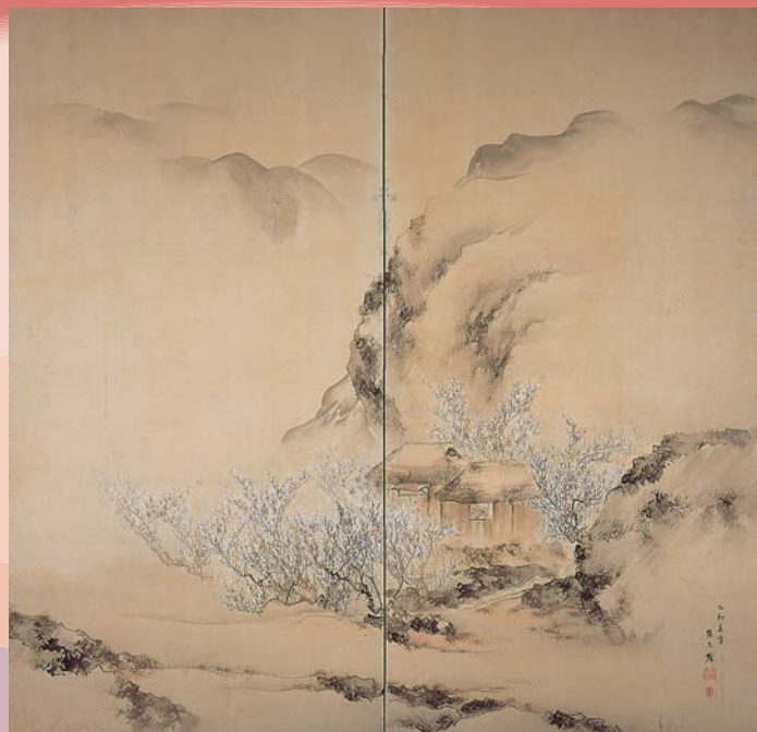
垣川文麟《梅花書屋図》安政2年(1855)

今回は、所蔵品の中から梅花を主題にした絵画・工芸品を集めて展示します。美術鑑賞の後は、松山城へ梅見というのも一興です。学芸員 長井 健