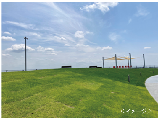
〈芝生広場イメージ〉