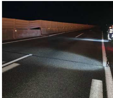
北陸自動車道 能生IC～糸魚川IC 古川橋 (令和6年1月1日)