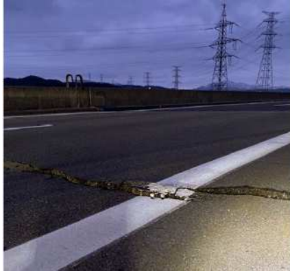
北陸自動車道 西山IC～柏崎IC 吉井川橋 (令和6年1月1日)