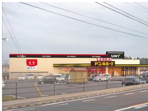
ドン・キホーテUNY可児店 周辺地図

名 称 : 「ドン・キホーテUNY可児店」 旧 店 名 : ピアゴ可児店 営 業 時 間 : 午前9時～翌午前2時 所 在 地 : 岐阜県可児市中恵土字溝向 2120 番 1 交 通 : J R 可児駅・名鉄新可児駅から徒歩約 20 分 開 店 日 : 2019 年 2 月 21 日 (木) 午前 9 時 売 場 面 積 : 約 3,600 m 2 (直営部分) 建 物 構 造 : 地上 1 階建 商 品 構 成 : 食品、酒、日用消耗品、家庭雑貨品、衣料品、 化粧品、玩具、カー用品、ブランド品、 家電製品、ペット用品、他 駐 車 台 数 : 約 200 台