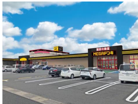
MEGAドン・キホーテUNY中里店 周辺地図