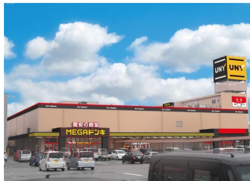
MEGAドン・キホーテUNY近江八幡店 周辺地図