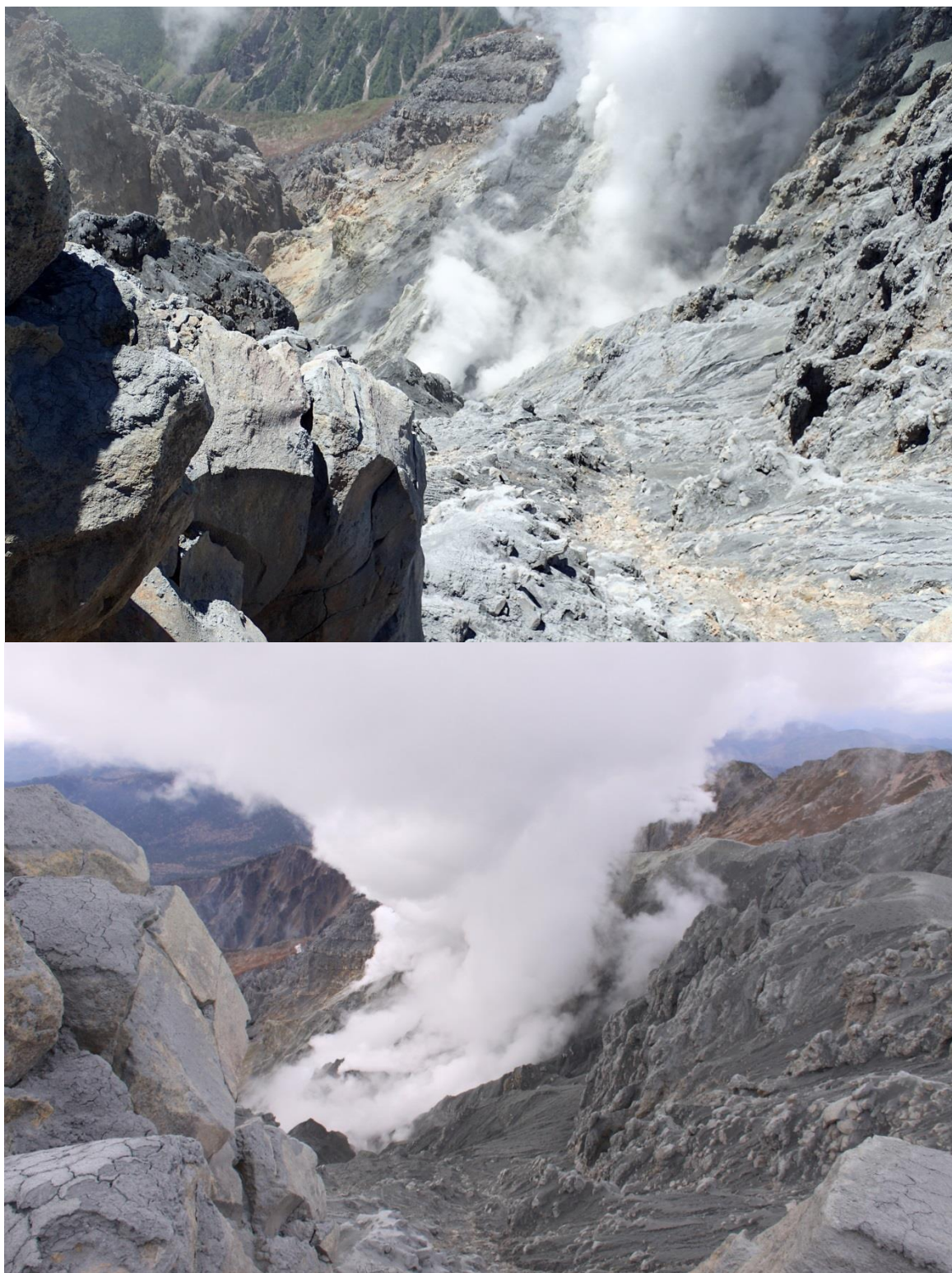
写真 6 剣ヶ峰山頂からの地獄谷内の噴火口. 上 : 2015 年 6 月 10 日撮影 下 : 2014 年 11 月 8 日撮影