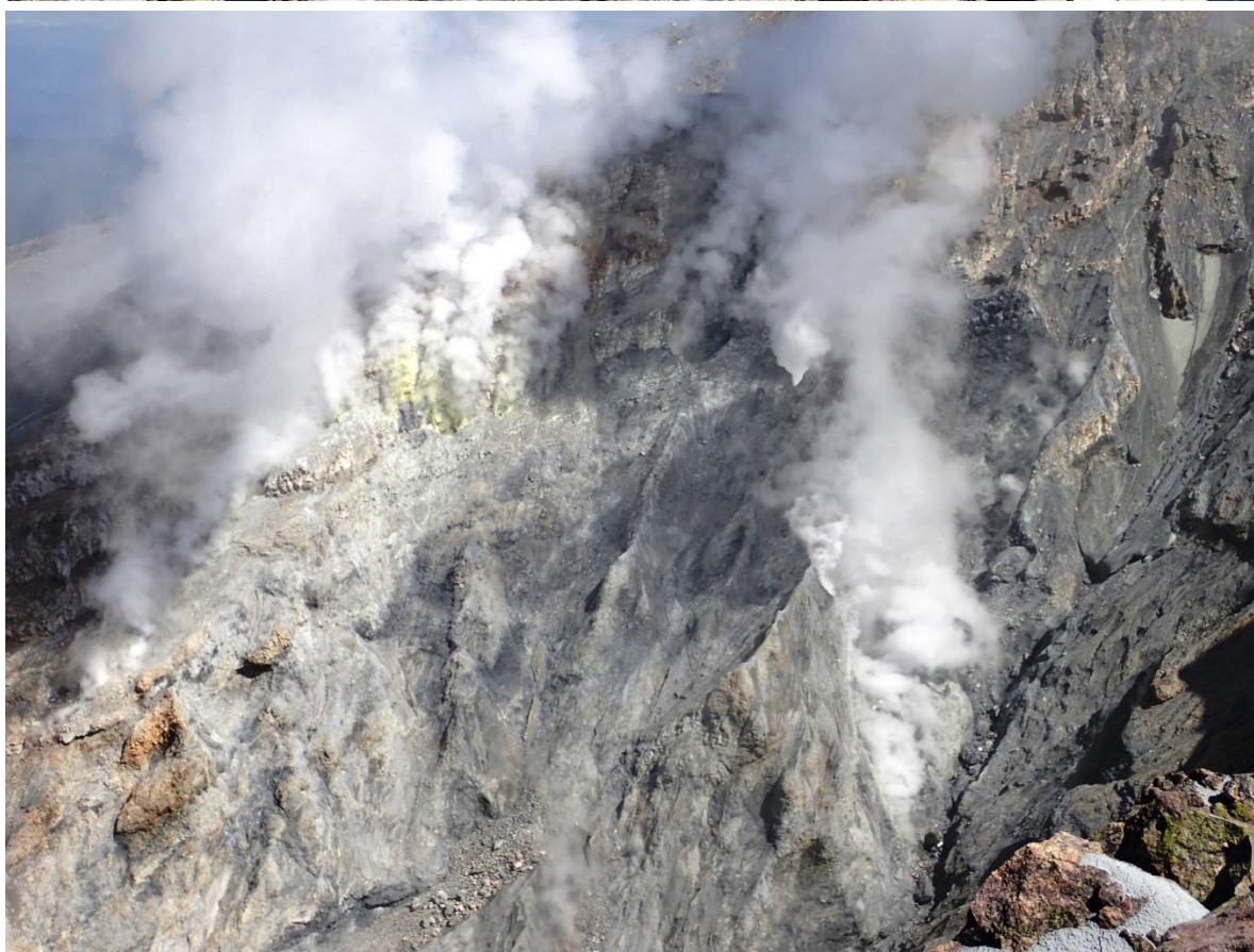
写真5 奥の院からの地獄谷内の噴火口全景（上）とその一部の拡大（下）.