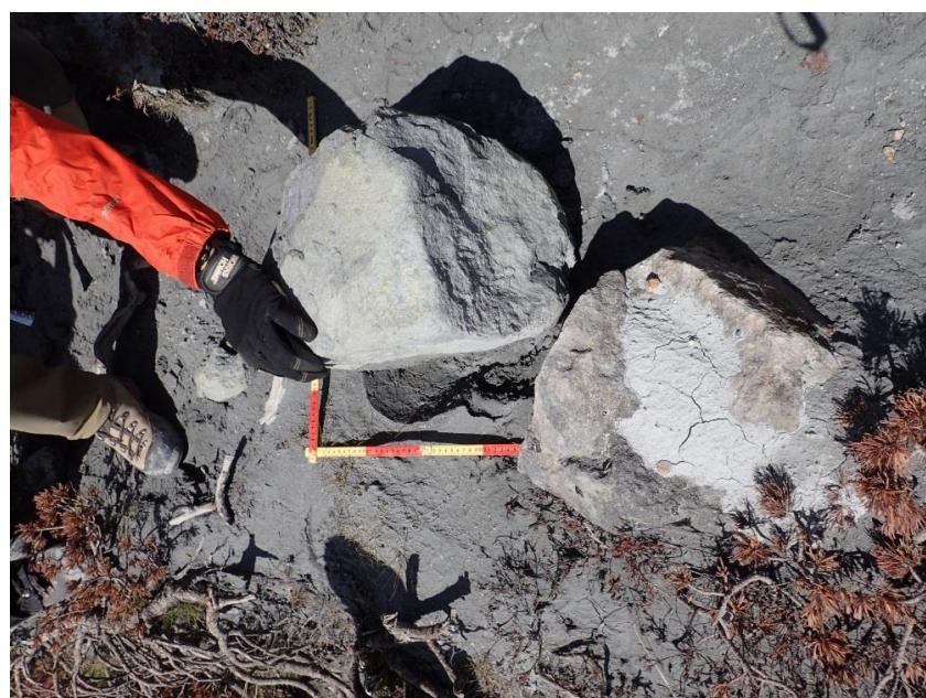
写真4 王滝頂上～奥の院間の噴石 (45 × 41 × 35 cm).