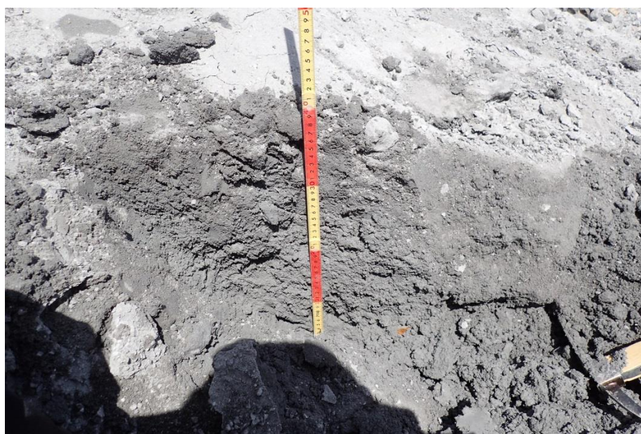
写真2 剣ヶ峰山荘下の登山道沿いの噴出物（層厚 40 cm）。