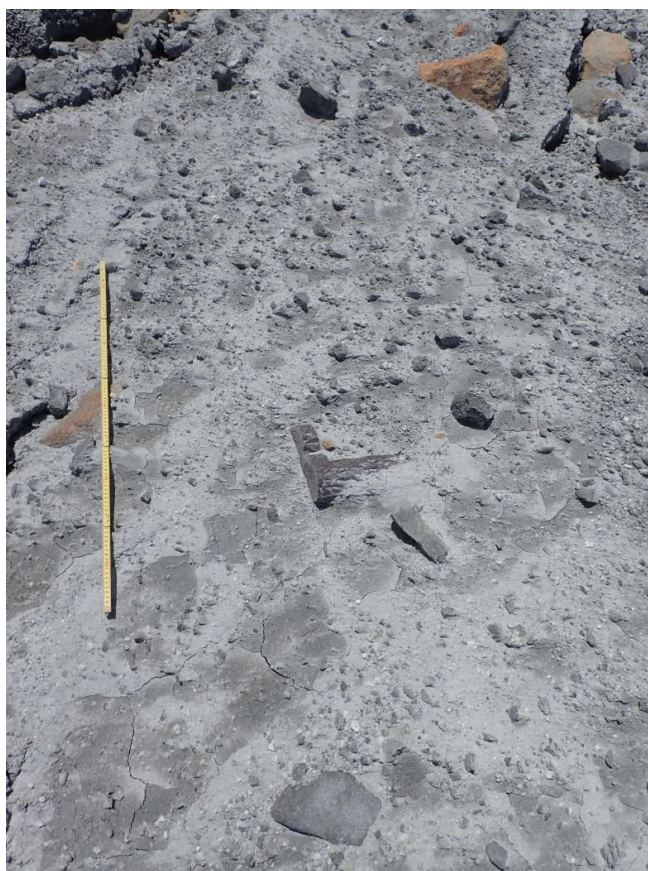
写真3 八丁たるみ上部の噴出物の産状。 粘土質の火山灰に火山礫サイズ以上の噴石が多量に混じる。折れ尺の長さは1m。黄色い折れ尺の右側に登山道の階段として使われていた擬木が埋もれているの見える。