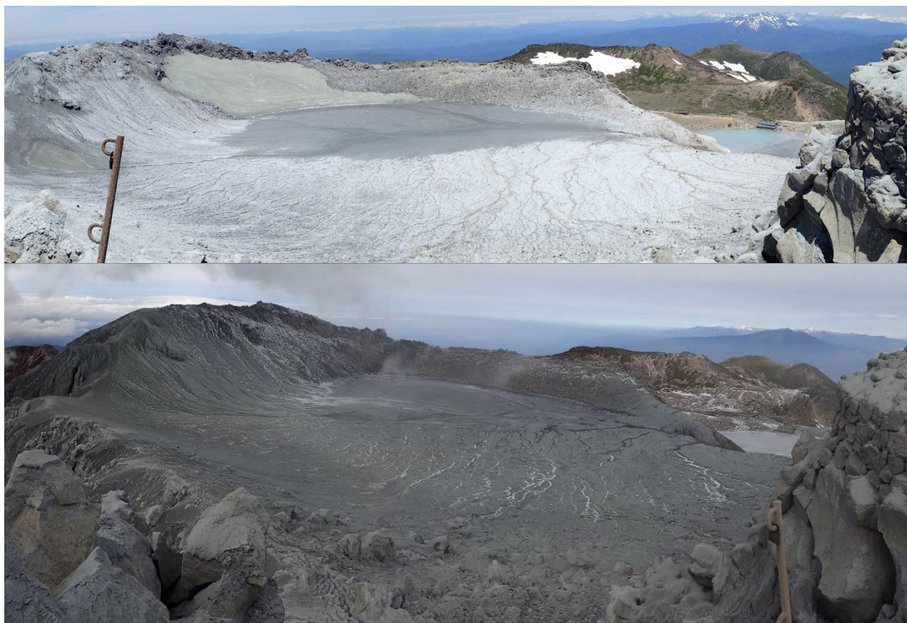
写真1 剣ヶ峰山頂から一ノ池を望む。