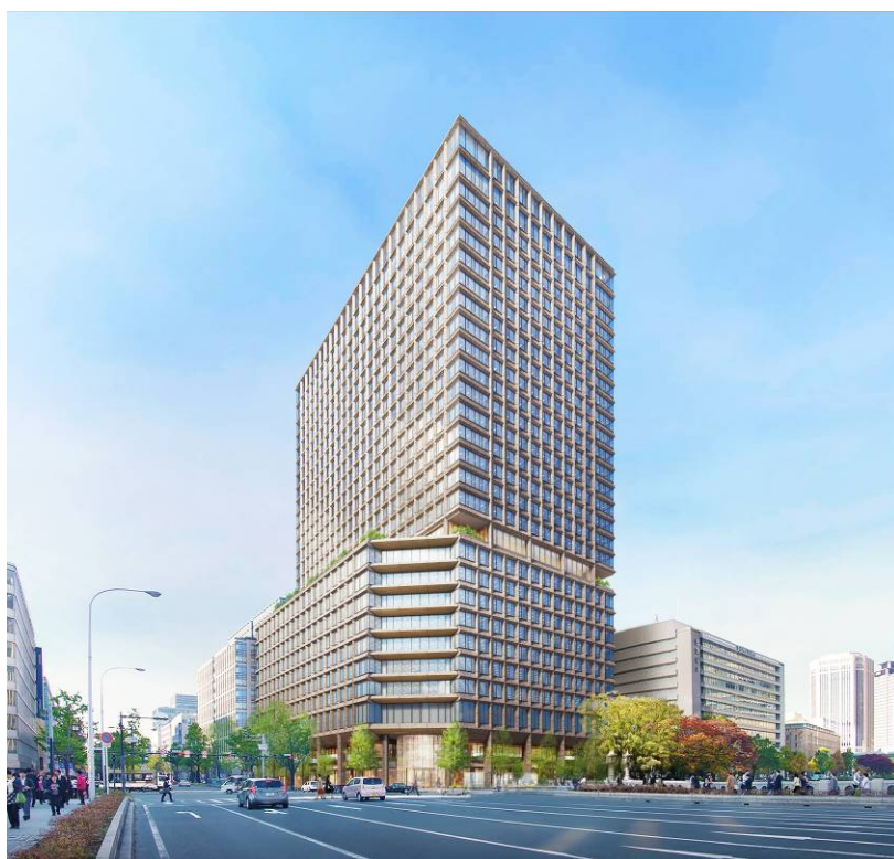
完成予想パース (北東より)

当事業では大和ハウス工業株式会社、住友商事株式会社、関電不動産開発株式会社が地権者かつ参加組合員として参画しており、今後も引き続き再開発組合とともに本事業を推進してまいります。