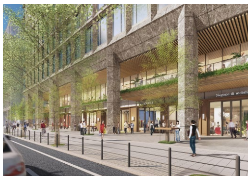
御堂筋沿道のイメージ

地下鉄淀屋橋駅と地下接続し、バリアフリー化・利便性向上を図るとともに、駅から連続した、ターミナルにふさわしい地下商業空間によるにぎわいを創出します。