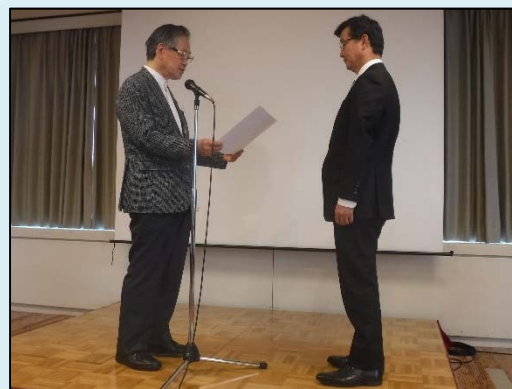
令和元年6月27日（木）に開催されたシンポジウムにおいて、表彰式が行われました。