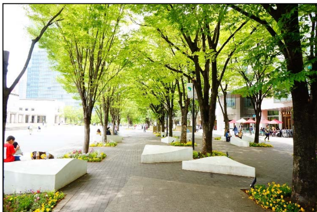
グリーンインフラを活用し、憩い空間を創出

※グリーンインフラ：自然環境が有する多様な機能を活用し、持続可能で魅力ある都市づくりを進めるための社会資本。