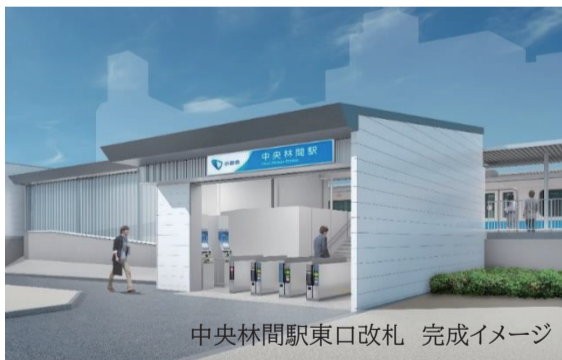
中央林間駅東口改札 完成イメージ

大和市と小田急電鉄株式会社は、国の「鉄道駅総合改善事業」の補助金を活用し、平成29年度から協力して駅改良事業を推進。11月27日、待望の「東口改札」が使用を開始しました。