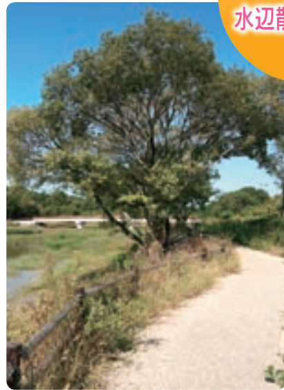
勅使水辺公園 水辺散策ゾーン 北

水辺散策ゾーン・北では、水や緑を身近に感じながら散策することができます。散策路には緑があふれ、人道橋からは勅使池の全景を見渡すことができます。