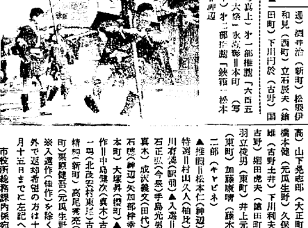
旭小学校の写真部員。写真コンテストの入選作品を発表した。

旭小学校の「体育」研究指定校となる。これは、旭小学校の体育教師が、社会性を養うための研究を行い、その成果を発表したためである。旭小学校の「体育」研究指定校となる。これは、旭小学校の体育教師が、社会性を養うための研究を行い、その成果を発表したためである。