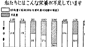
私たちにはこんな栄養が不足しています (We lack such nutrition). A note explaining the data in the bar chart above.

Text stating that two out of every three cases of blindness (失明) are caused by trachoma (トラコーマ).