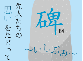
芭蕉句碑 花山町 (つつじが岡公園内) 市史編さんセンター (Tel.76-7651)