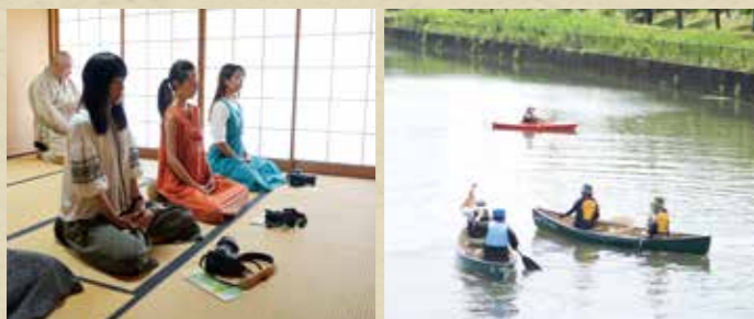
左：茂林寺での座禅体験／右：鶴生田川でのカヌー・カヤック体験

構成文化財を活用し、里沼の魅力を感じることができるアクティビティやワークショップなど、さまざまな事業を実施しています。 観光客のかたはもちろん、地元のかたも知らなかった里沼の魅力に気づけるかも里沼公式ウェブサイトや広報館林などで随時お知らせしますので、ぜひご参加ください。