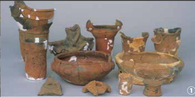
①蛇沼及び間堀遺跡出土品／「祈りの沼」茂林寺沼の東部にある周囲約1kmの細長い沼、蛇沼周辺には湿原が残り「里沼」の原風景を残す。隣接する台地上には縄文時代から続く間堀遺跡があり、出土品の縄文土器から沼辺で生きた縄文人の暮らしと「祈り」の心がうかがえる