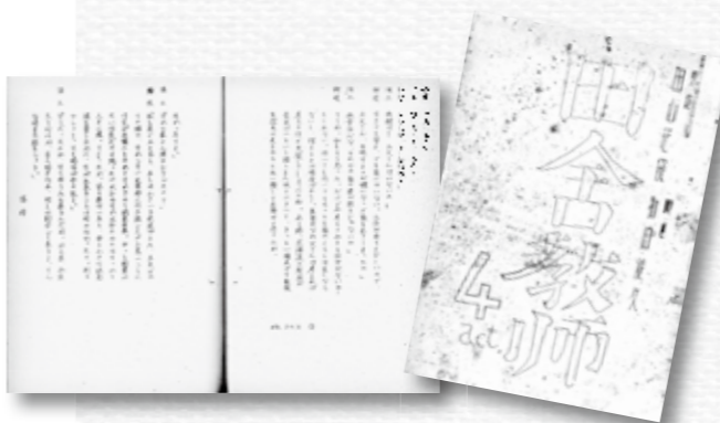
演劇「田舎教師」脚本 act.4 (館林市立図書館所蔵)

令和3年(2021)は田山花袋生誕150周年になり、田山花袋記念文学館では記念特別展などが行われます。これまでも花袋の生誕・没後の節目には、市でさまざまな企画が行われてきました。その一つに、花袋の代表作である『田舎教師』を演劇化する企画がありました。