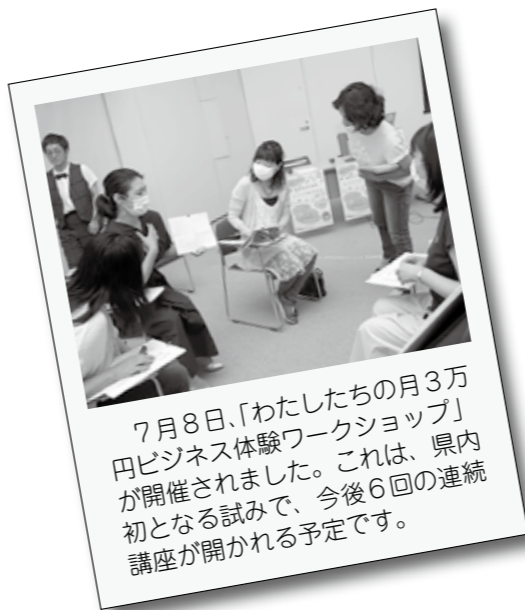
7月8日、「わたしたちの月3万円ビジネス体験ワークショップ」が開催されました。これは、県内初となる試みで、今後6回の連続講座が開かれる予定です。