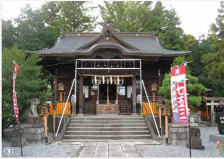
③長良神社と館林城下町の総構え／長良神社の周囲には総構えの土塁と堀を利用した水路が残る。中世・近世の館林地域の沼辺の開発と、「守りの沼」城沼を要害とした城下町建設につながる「里沼」の歴史を伝えている