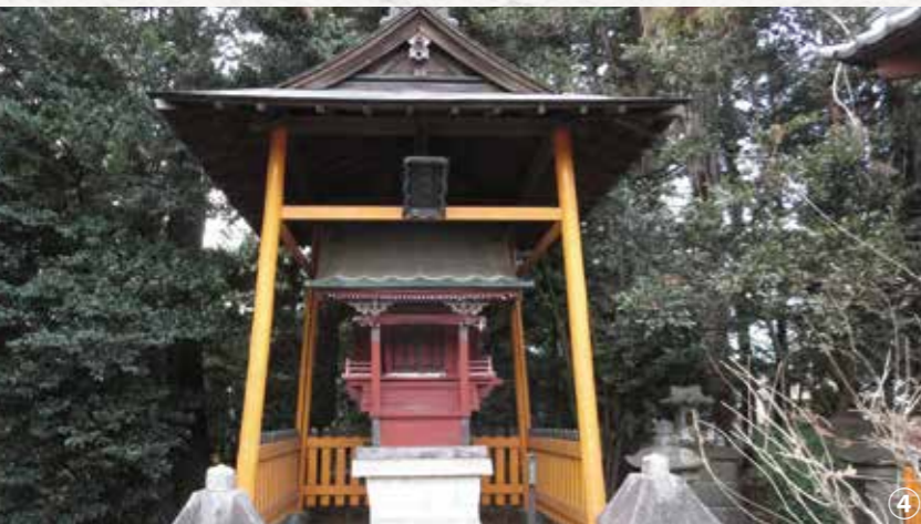
④織姫神社と館林紬／館林地域は江戸時代から綿花栽培が盛んで、農家の副業として機織りが行われ、城下町には多くの綿屋商人がいた。明治時代以降、城下町に織物組合が結成され織姫神社がまつられた。「里沼」のもてなし文化を支えたさまざまな織物が生まれた中、「館林紬」は今も続く伝統工芸品である