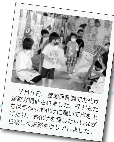
7月8日、渡瀬保育園でお化け迷路が開催されました。子どもたちは手作りお化けに驚いて声を上げたり、お化けを探したりしながら楽しく迷路をクリアしました。