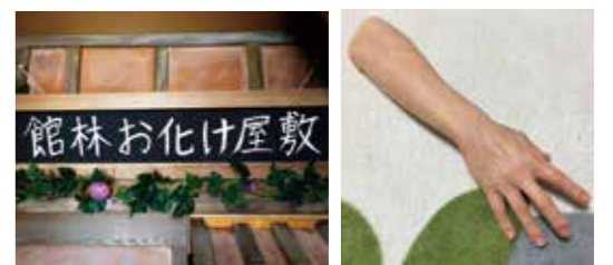
エントランスに掲げられている「館林お化け屋敷」の看板（写真左）。浮かび上がる血管や毛穴までが忠実に再現され、今にも動き出しそうな腕の模型（写真右）

profile 平成8年、城町に生まれる。専門学校在 学中から、お化け屋敷の設計施工会社で アルバイトをしつつ、ノウハウを学ぶ。 現在は、フリーランスで各地のお化け屋 敷作りを請け負うほか、特殊メイクや造 形物の製作などを手がけている。