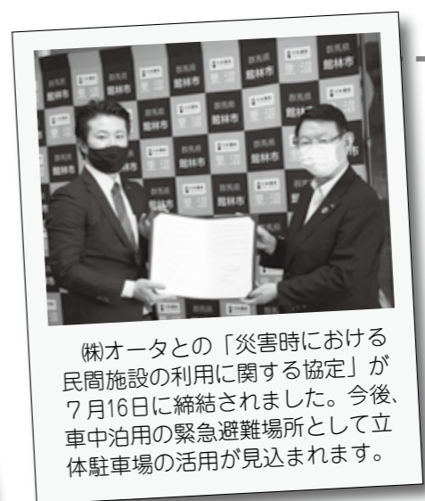
㈱オータとの「災害時における民間施設の利用に関する協定」が7月16日に締結されました。今後、車中泊用の緊急避難場所として立体駐車場の活用が見込まれます。