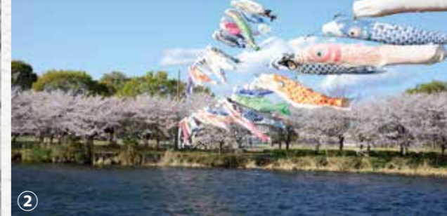
②近藤沼 (ホリアゲタ)／市南西部にある周囲約2.5kmの沼。明治時代に造成されたくしの歯状の水田と水路が存在した。沼底の土を掘り上げて造ったことから「ホリアゲタ (別名キロコボリ)」と呼ばれ、多々良沼同様、「実りの沼」として暮らしを支えてきた (写真左は当時のホリアゲタ)

認定文化財、ストーリーの詳細、里沼の最新情報は、里沼公式ウェブサイトへ https://sato-numa.jp/