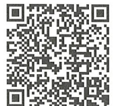
YouTube 塩竈市 公式チャンネル