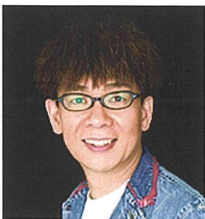
山寺 宏一 さん

塩竈市の公式ホームページ、フェイスブック塩竈市のページ、YouTube 塩竈市のチャンネルにて、 5月1日（金）から配信を開始します。 第一弾として山寺宏一さんからスタートします。