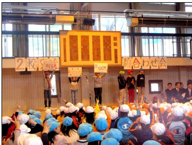
(真駒内曙小と真駒内小の「顔合わせ会」の様子)

真駒内南小学校と真駒内緑小学校では、6月16日に両校の4年生が、厚別区新さっぽろにある青少年科学館を見学し、その後お弁当を一緒に食べたり、自己紹介ゲームを行ったりして、交流を深めました。今後も、5年生の宿泊学習など学年ごとの交流や「真緑まつり」・「マコみなフェスタ」など学校全体での交流を行っていく予定です。