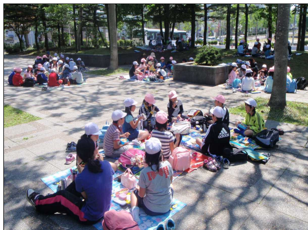
(真駒内南小と真駒内緑小の4年生が「青少年科学館見学」の後、一緒にお弁当を食べている様子)