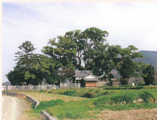
お天神さんの大楠