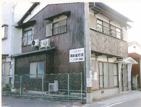
岡本ちょうちん店