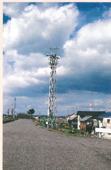
高丸集落の火の見櫓