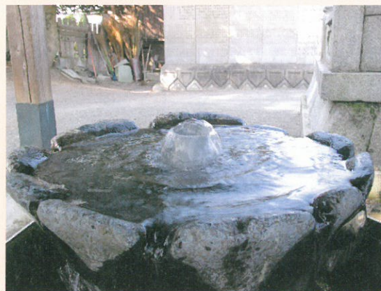
嘉母神社の手洗い水

また、分家である八幡の久米家も同様な備えがあり、風格あるたたずまいを見せている。