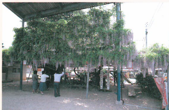
阿弥陀寺のノダフジ

境内に「ノダフジ」の巨木があり、市の天然記念物に指定されている。藤棚の下に、天正の陣でこの地に戦死したといわれる今井玄蕃頭の祠がある。