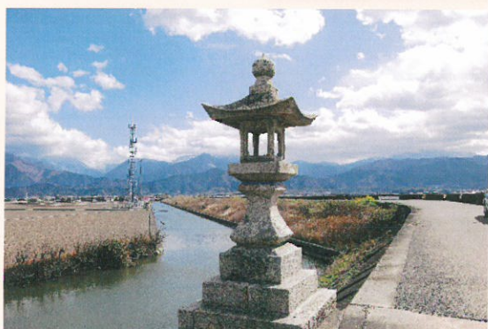
禎瑞の石鎚常夜灯

難波地区の自治会では、この広場にクロケータ場を作り、藤の木を植え、交流の場とした。丹精な世話が実り、藤は大きく枝を張り、最近では若々しい美しい花をいっぱいつけるようになった。噂を聞いて多くの人が訪れるようになり、婦人会ではうどんやおでんを提供することにした。