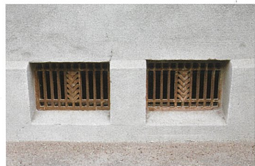
アール・デコ調の換気口