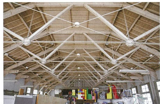
木材と鋼材の混構造トラス

内外部の意匠には当時流行したゼツェーション様式や、アール・デコの影響が感じられます。