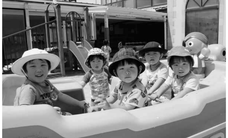
▲西脇こども園の子どもたち

午前中は幼稚園部や保育園部に関係なく、3歳～5歳は年齢ごとの同じクラスとなり、同じカリキュラムで教育を受けていただきます。幼稚園部は午後2時ごろ降園しますが、保育園部は午後から保育を受けます。また、保育園部については保護者等の就労等の時間により、午後4時ごろに降園する短時間認定と午後6時ごろに降園する標準時間認定があります。