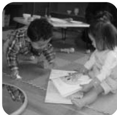
写真: ピッコロハウスにて

子どもと子育て家庭に関するあらゆる相談に、保健師、保育士等相談員が応じています。「遊びながら食事をして困っています」「お友だちとうまく遊べない」等の日常生活での悩みもたくさんお受けしています。秘密は厳守しますので、気軽にご相談ください。相談内容によって、月1回実施の専門相談も受けられます。 <相談日> 火～土曜日(祝日はお休み) 受付: 午前9時～午後4時