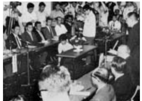
条件派との話し合い(昭和42年6月26日)

12月に市の現況を正確に把握した、成田市開発計画基本現況図集を作成、翌42年度には、観光・農業と空港関連産業の三つの柱を軸とする13項目の重点施策、総合開発計画基本構想と、この構想に基づく具体的事業を示した、総合開発実施計画を発表しました。主な事業として、成田ニュータウンの造成、国鉄成田駅西口土地区画整理事業、根本名川河川改修事業などが計画され、昭和44年度から事業に着手しました。