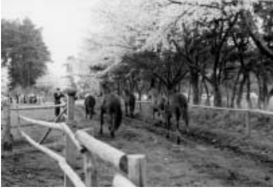
桜と馬で親しまれた 下総御料牧場