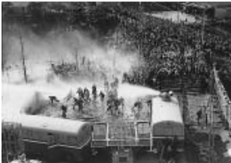
市役所前のバリケードを突破したデモ隊に放水を浴びせる機動隊(昭和43年2月26日)

その後反対運動は、学生運動や労働運動の盛り上がりとともに一層激しさを増しました。特に昭和