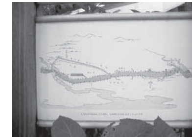
東海道分間延絵図