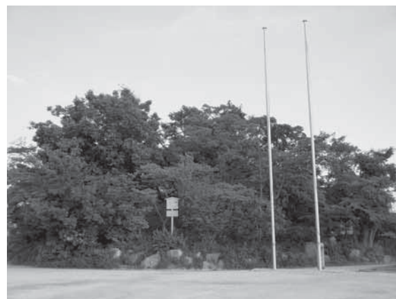
瑞穂古墳（第1号）豊岡小学校