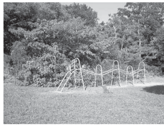
瑞穂古墳（第2号）瑞穂公園南児童園