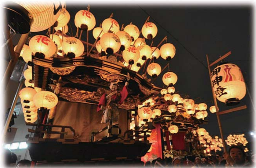
提灯も華麗に本町に並ぶ山車

鳴海のもっとも古い記録である『蓬東大記』には、馬の塔、傘鉾、踊りのほか、山車や釣り屋形などが記載されています。江戸時代のはじめまでは、表方、裏方という区別はなくひとつのお祭りを楽しんでいたようです。元禄のころ表方(鳴海八幡宮)、裏方(成海神社)がそれぞれお祭りをするようになったとされます。