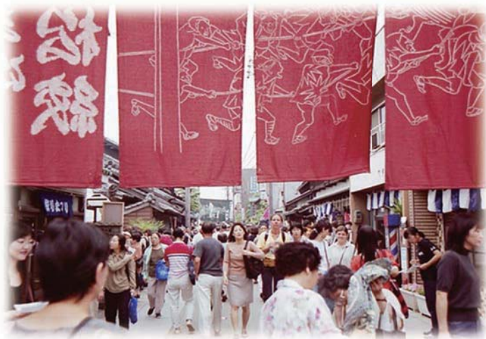
絞まつりでにぎわう東海道

りを曳かれた山車で、下玉屋町(中区)が建造した若宮祭りの祭車で、水引幕・大幕ともに豪華な刺繍で彩られています。中町の「唐子車」は天保（1830～44）のころに、知多の豪商が建造し、明治8（1875）年に有松が買い受けたものです。唐木づくりに青貝や珊瑚で細工に工夫を凝らした造りとなっています。西町の「神功皇后車」は明治6（1873）年に、有松が建造した