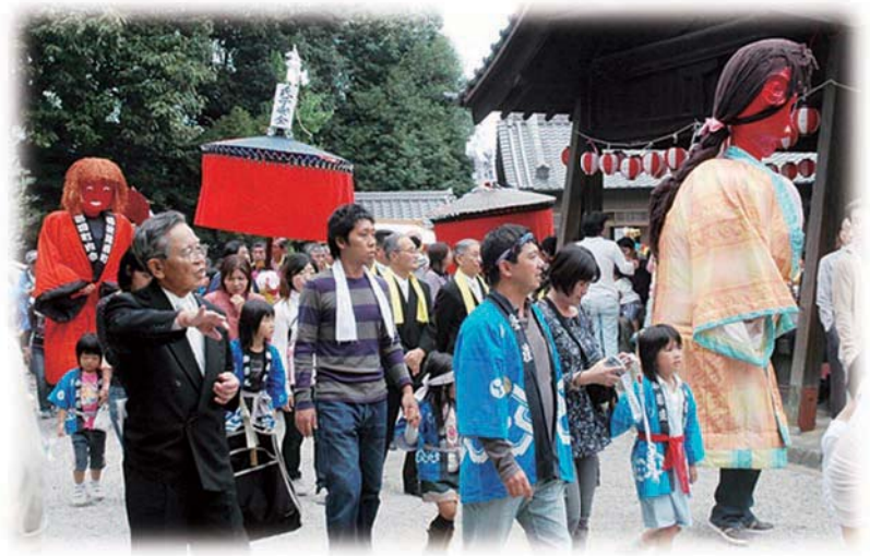
神明社に練り込んだ笠鉾と猩々

桶狭間には「桶狭間神明社の祭礼」と「桶狭間古戦場まつり」があります。神明社の祭りは、宝暦5（1755）年の『尾陽村々祭礼集』に、知多郡桶狭間村「神明宮の祭、馬の塔式疋、郷内より神明迄引渡、祭日八月十六日、右社同村長福寺扣」と書かれています。馬の塔や傘鉾、音頭台の出るにぎやかな祭りが寛文10（1670）年ころから練り広げられていました。