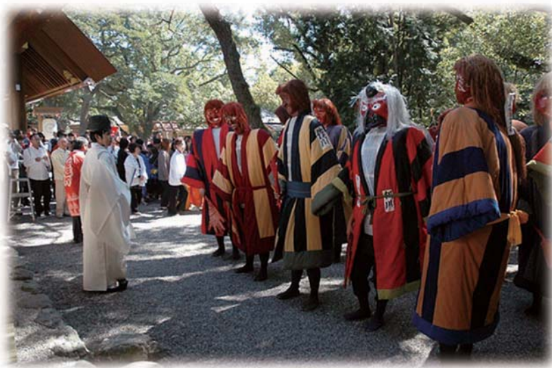
熱田神宮本殿遷座祭に参集した猩々

安永8（1779）年の『鳴海祭礼図』に祭りに参列する猩々が描かれており、江戸時代に猩々の存在していたことが確認できます。猩々の役割には2つがあり、1つは祭礼の警護と先導役で、もう1つは子供たちを追いかけて遊ばせるのが役目です。