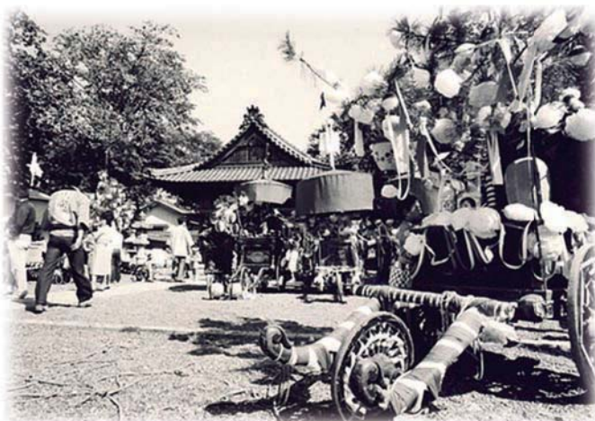
八幡社に並ぶ山車 昭和56年

れています。記載によれば警固の人数だけでも100人を超え、馬の塔が中心の祭りだったようです。高力猿猴庵の『行事絵抄』には現在のような山車(松車・傘鉾車)が境内に繰り込む様子が描かれています。