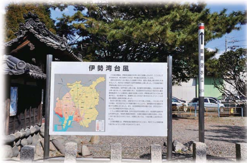
津島社で伊勢湾台風の怖さを知らせる掲示板

また、流された家は16軒、倒壊家屋は103軒、床上浸水は500軒近くありました。被害を受けた300人ほどが大高中学校（現在の大高北小学校）で、1ヵ月もの間生活をしました。鳴海小学校の児童の家は全壊45人、半壊141人、床上浸水48人の被害がありました。幸いにも死者はありませんでした。