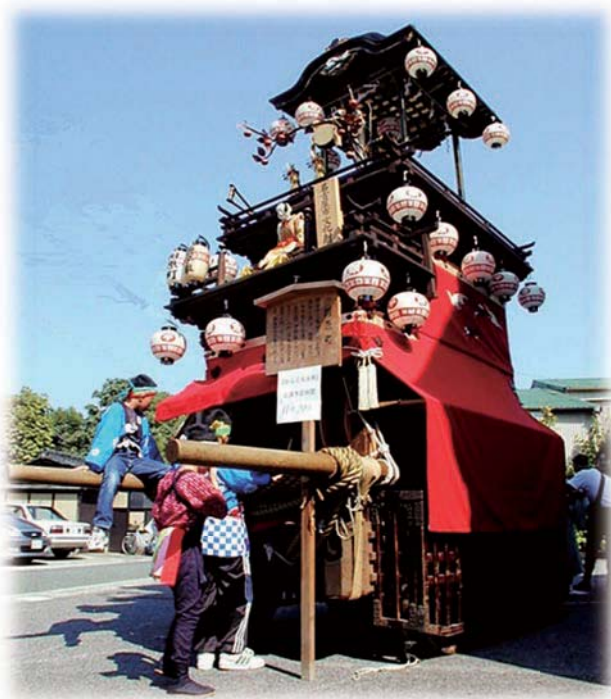
名古屋市指定有形民俗文化財 相原町の山車

す。 鳴海八幡宮例大祭（表方祭）は、東海道を、傘鉾、獅子、神輿、猩々と共に、作町・根古屋・本町・相原・中島の5輛の山車が練り出します。これらのうち、からくり人形を乗せた相原の名古屋型山車（名古屋市指定有形民俗文化財）を除く4輛はこの地方で発展したもので、祭り囃子を主とした山車です。東海道を練り歩いた山車は、作町の交差点に集まり、東の宿場の入口である平部の常夜灯へ向けてゆっくり進んでいきます。また、夜になると、各山車が提灯を灯し曳かれます。ゆらゆらと揺れる提灯の灯はとても幻想的で、昼とは違った趣があります。楯取り連の衣装はとても粋で、腰に赤・黄・緑・豆絞りなど色とりどりの手拭をきれいにたたんで巻きつけており目に鮮やかです。