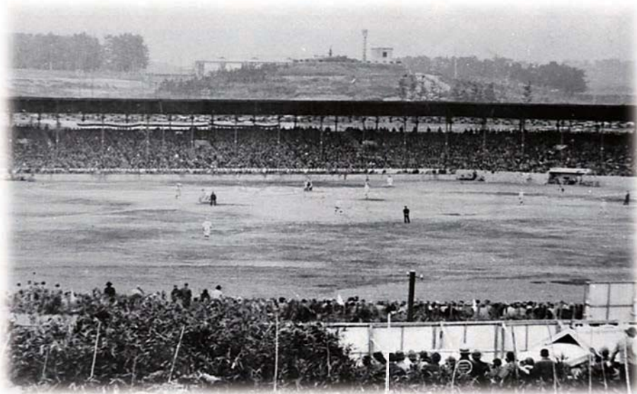
プロ野球を観戦する人たち 昭和11年

愛知電気鉄道（現名古屋鉄道）が昭和2（1927）年に建設し愛電球場として誕生しました。日本で最初にプロ野球の試合が行われた歴史的な球場です。