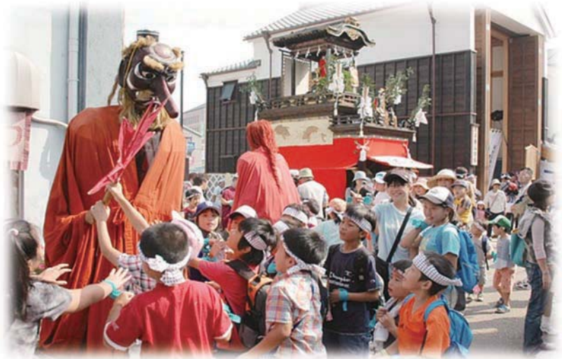
山車の横で天狗と戯れる子どもら

間近にみるすることができます。3輦の山車のうち2輦は、人形が文字を書きます。布袋車と唐子車に文字書き人形が乗っています。東町の「布袋車」は江戸時代に名古屋城下の大通