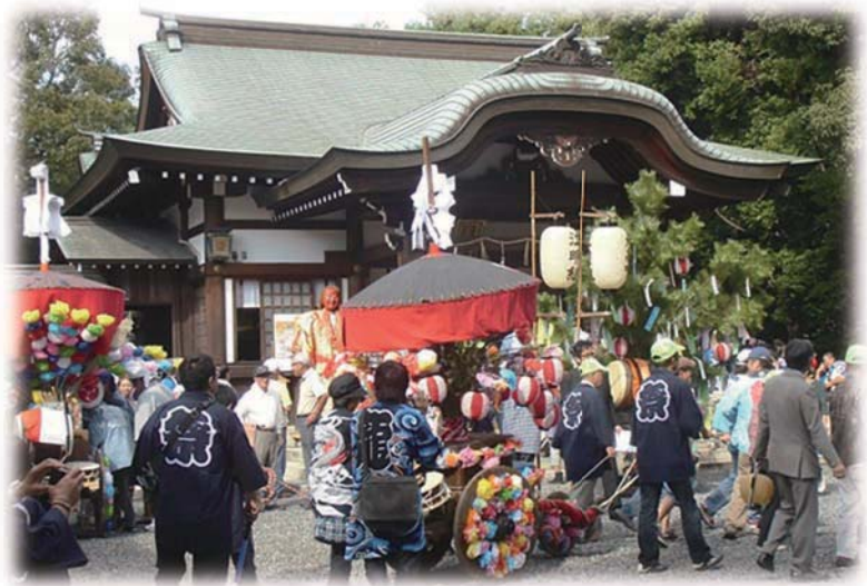
氷上姉子神社に参集した山車

『尾陽村々祭礼集』には宝暦年中(1751~64)「八月朔日 馬の塔七疋 警固九十二人 同一疋 警固八人 込高新田より出郷内より神前へ引き渡す」と書か