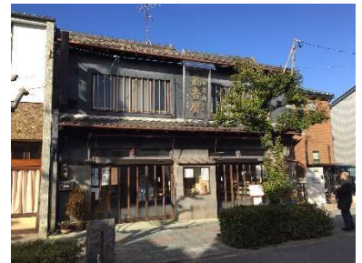
昭和27年 店舗 瑞穂区惣作町2丁目12番地 H29.2.7