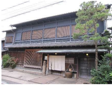
明治～大正頃築、平成4年移築改修 店舗 北区上飯田西町2丁目36番 H28.12.16