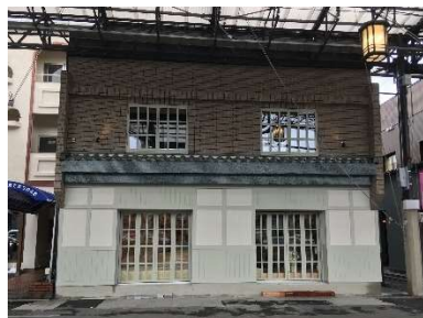
昭和26年 店舗 西区那古野一丁目35番13号 H29.2.22