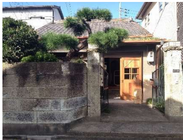
昭和41年 店舗 中村区深川町3丁目33番地 H29.2.7