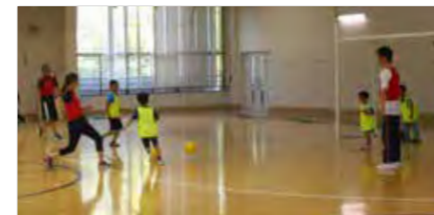
▲フットサル場として改装された館内 ※現在は新型コロナワクチン接種会場として使用中