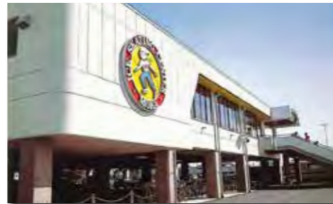
▲スケートをする子どもが描かれた大きな看板が目印