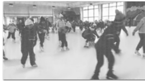
▲スケートセンターとして人気を集めた昭和60年代