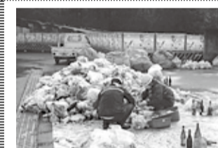
甘南備園で廃ガラス瓶を分別回収

のある人や高齢者をはじめすべての人が利用する際の安全性と利便性を実現するための整備基準に適合しています。そのほかの特徴は次のとおり 車道部の舗装材は舗装面のわだち発生を防ぐ半たわみ性舗装 歩道部のブロック舗装材は環境に優しい、滑りにくい透水性リサイクルのブロックを使用 植栽は高木によって四季の変化を感じ取れるよう構成。センベルセコイヤ・サクラ・ケヤキなど 照明は竹をモチーフとしたハイボール式 バスシールド式 に、空気を浄化できる膜素材で光触媒仕様の 【問合せ先】 三山木整備課 ☎65・5540