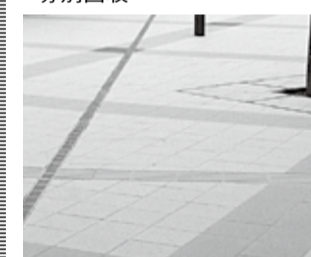
廃ガラスを再利用したブロックを使った歩道