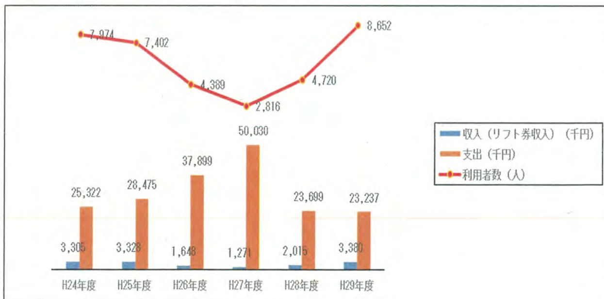
【図2】最近5年間の収支、利用人数