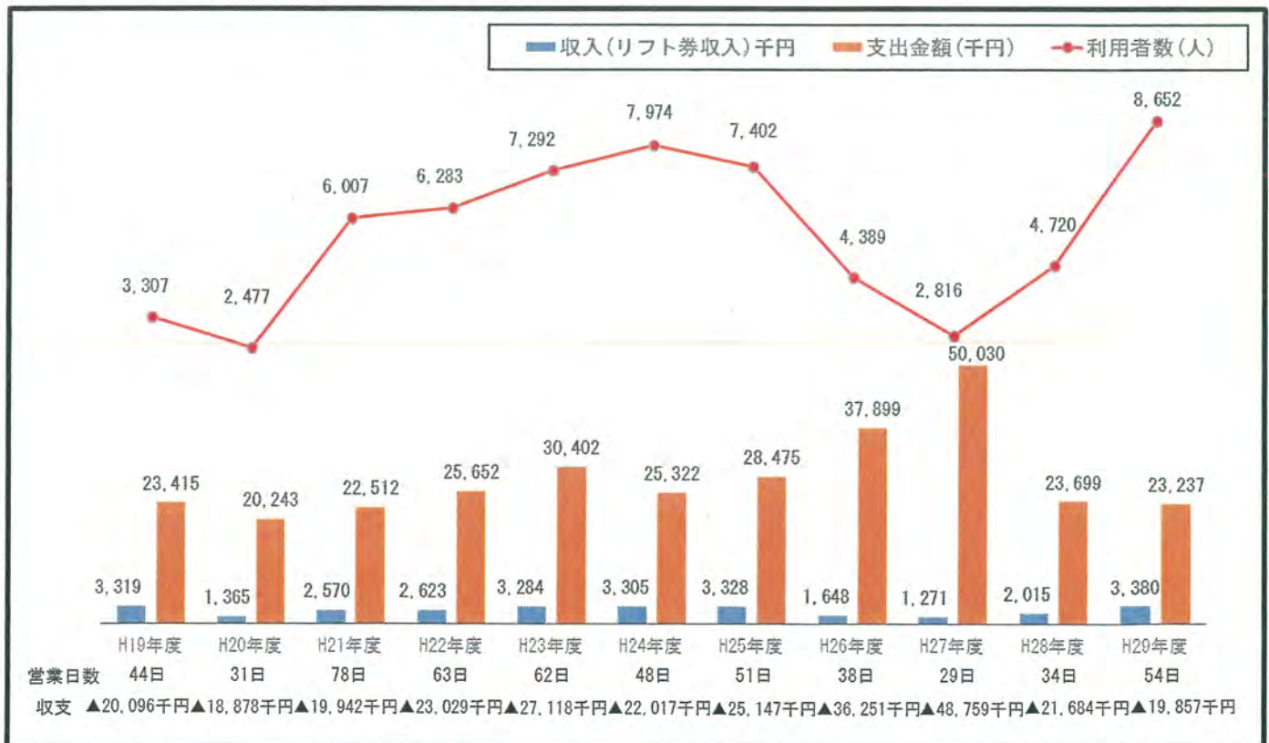
【図1】宇奈月温泉スキー場の営業状況推移

概ね20,000千円前後の赤字で推移していますが、平成26年度は第1ペアリフトの保護設備損壊に伴う休止により、代替輸送手段として雪上車を使用したこと、平成27年度は同設備の復旧工事を行ったことから、収支が極端に悪化しています。