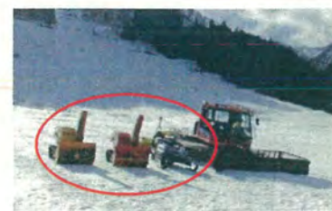
除雪車、スノーモービル