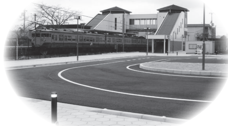
送迎にも便利な北口の駅前広場

生まれ変わった寺庄駅、ますます多くの皆さんにご利用いただき、将来の複線化につながっていくことが期待されます。