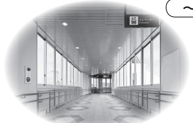
南北行き来できるようになった 自由通路