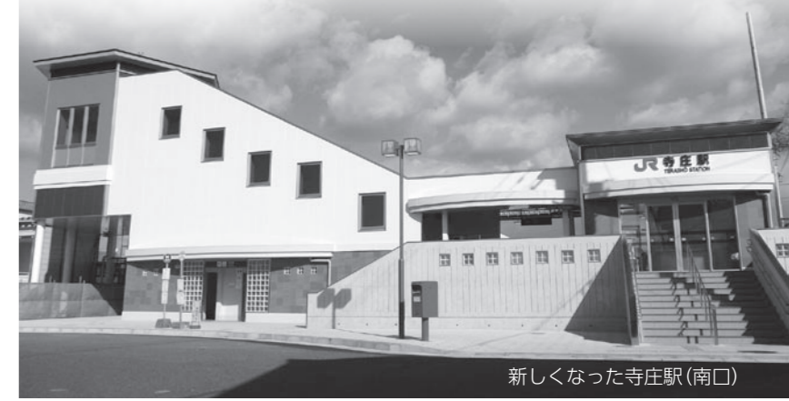
新しくなった寺庄駅(南口)

おとし9月から工事が始まったJR草津線寺庄駅の駅舎および駅前広場が完成し、3月21日にすべての施設が利用できるようになりました。