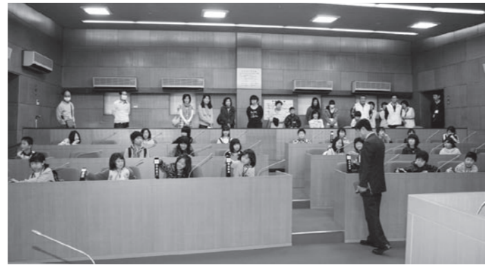
議場を見学する子ども議員

「かふか21子ども未来会議」は、次世代を担う子どもたちが、甲賀のことを学び、体験する中で感じた、「こうすれば甲賀がよくなる」という意見を市に提案・提言する子ども議会です。