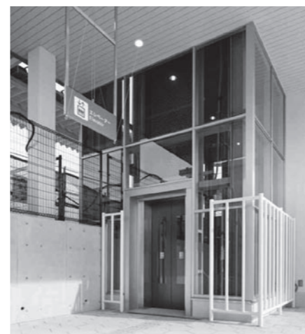
南北両側にエレベーターを設置

今回の整備では、線路をまたぐ自由通路が設けられ、従来どおりの南側からの駅利用に加え、踏切を渡ることなく北側からの駅利用が可能になりました。また、電車とホーム間の段差を解消するとともに、南北両側にエレベーターを、南側には多機能トイレも備えるなど誰もが安心して利用できる施設となっています。新設の北広場にはロータリーを設置し、バスの発着や自動車での送迎が安全にできるようになりました。