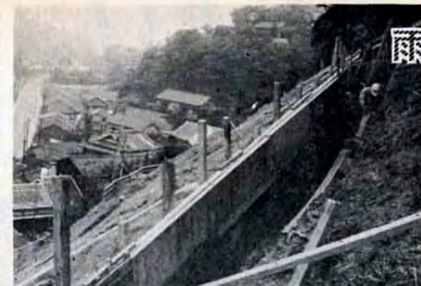
門司区長谷町に県が防災工事中

日曜日の午後5時 10チャンネルを回して 毎週日曜日の午後5時から15分間、テレビ西日本（10チャンネル）を通じて市政番組「こんには北九州」を放送しています。茶の間のみなさんといっしょに、当面する市政のいろいろな問題を考える番組です。