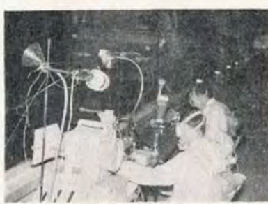
ガスマスクをつけて測定する係員

トンネル内は一日中排気ガスが充満し、車両運転の妨げになるばかりでなく、トンネル内で事故発生したときは大惨事となることも考えられたため、このほどトンネル内の実態調査を行なったものです。