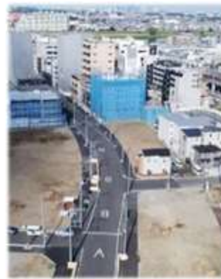
空中から撮影した 登戸2号線周辺 (令和3年9月頃)

向ヶ丘遊園駅北口周辺では、登戸2号線(アトラスタワー前)の道路整備が順調に進み、4月から部分開通します。また、中央銀座商店街周辺の建物解体工事が終わり、新しい区画道路を整備していくため、4月に中央銀座商店街通りを廃道します。区役所通り登栄会商店街では、建物解体工事と並行して、順次、道路側溝などの工事を行っています。これらの整備後は駅から区役所方向へ車線を一方通行化することで、両側に歩行空間を確保して無電柱化を図るなど、登栄会商店街が目指すまちの将来像である「ここに来たい、住みたいと思える街」の実現に向けた取組を進めます。 また、これらの事業進捗に伴って、3月末から順次、路線バスのルートの一部変更します。小田急バス・神奈川中央交通では、区役所前バス停を経由して登戸1号線を通るルートに変更します。川崎市バスでは、向ヶ丘遊園駅の前には停車せずに、「多摩区役所前」の次は「登戸駅」に停車することに変わりますので、ご利用の際はご注意ください。 令和4年度からは、向ヶ丘遊園駅前広場の整備にも着手します。バス・タクシー乗り場や一般車・障害者用停車スペースの確保のほか、広場の無電柱化やシェルター(上屋)、ベンチの設置など、誰もが安心して利用しやすい駅前広場の整備を進めます。また、登戸1号線では電線共同溝工事を実施します。交通動線を切り替えながら段階的に工事を行いますので、通行にご不便をお掛けしますが、ご理解とご協力のほど、よろしくお願ひします。