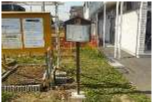
事務所近くの高札

登戸区画整理事務所の近くに立つ高札にQRコードが掲示されています。是非お探しください。QRコードを読み取ると、今と昔の街中の写真を比較したコンテンツを見ることができ