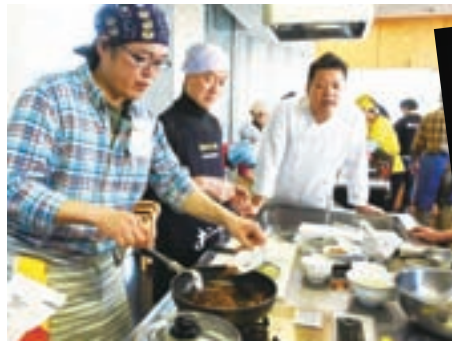
▲一流シェフの手ほどきを受けながら本格的な中華料理に挑戦

寒さも緩み春のような陽気となった2月13日に、アミューゼ柏で「オヤジ☆イノベーション」が開催されました。柏のオヤジたちがステージでパフォーマンスを繰り広げたり、体験教室などで交流をしたりと、オヤジたちはパワー全開!そんなオヤジたちに元気をもらい、訪れた人も一緒にダンスなどで盛り上がりました。今回で3回目の開催となり、柏には元気なオヤジが増殖しています。知人の応援に訪れたという女性は「お父さんが活動的だと家族で外に出ることも多くなって、街もにぎわいますよね。うちのお父さんも…」と、期待する思いを寄せながら元気なオヤジたちを絶賛していました。