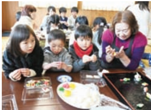
▲ちょっと丸くてもご愛嬌、鳥の形を作るのは難しい