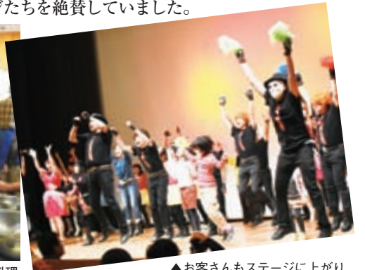
▲お客さんもステージに上がり盛り上がりは最高潮