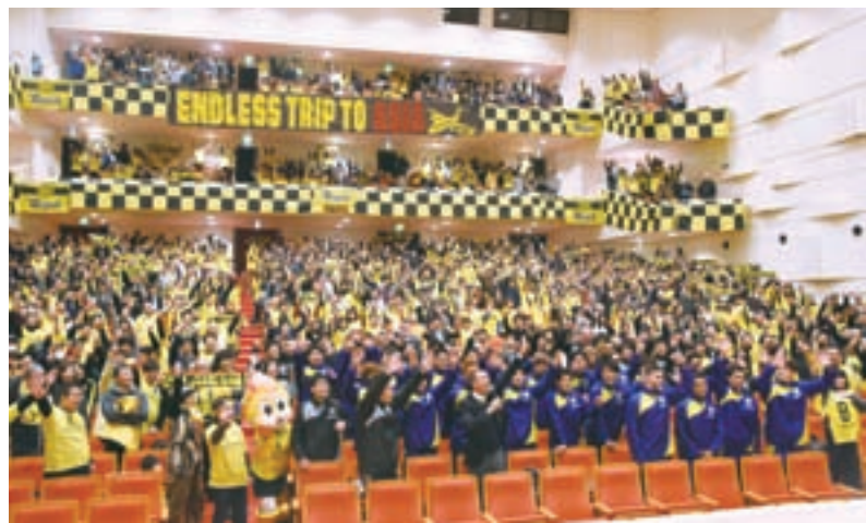
▲メンデス監督のサプライズで選手全員が参加して、サポーターと記念撮影

1stステージ 2月27日~6月25日(土) 2stステージ 7月2日(土)~11月3日(木)