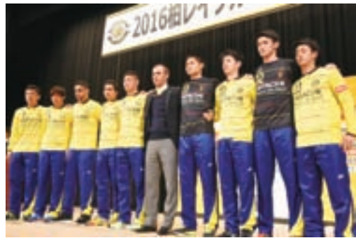
▲新加入選手9人に期待が高まります