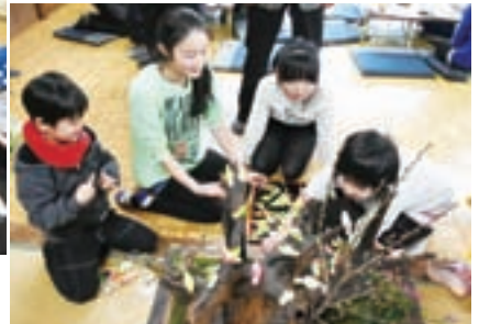
▶きれいに飾り付けができました