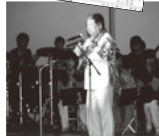
▲柏市市制施行50周年の記念式典で演奏を披露