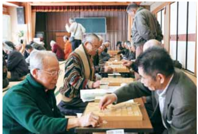
第38回シニア文化祭 将棋大会

「う～ん、難しいな」「しまった、やられた!」と聞こえてきたのは、将棋の対局上でのこと。囲碁・将棋大会の会場には、約120人のシニア世代が集まり、パチッ、パチッと日ごろの成果を競い合う真剣勝負を繰り広げていました。(総合福祉会館 ほか)