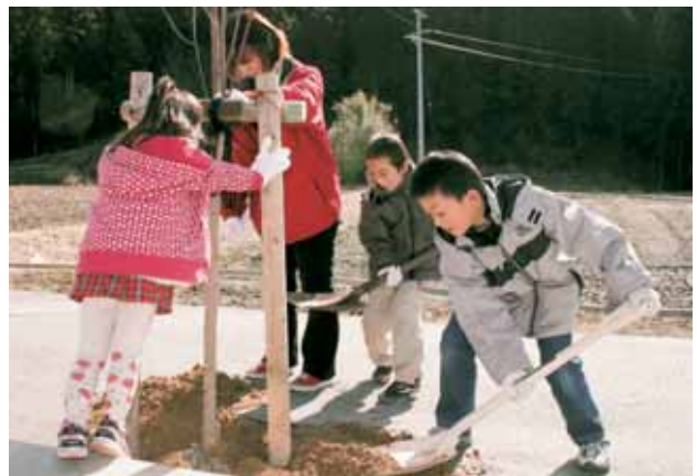
桜植樹ボランティア

植樹に参加した皆さんからは「早く大きくなってね」「桜、きれいに咲くかなあ」と、今から桜の開花を楽しみにする声が多く聞かれました。