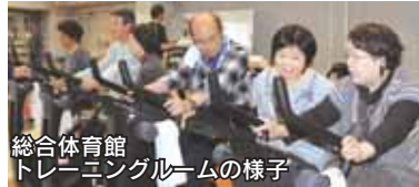
総合体育館 トレーニングルームの様子

総合体育館・市民プールのトレーニングルーム利用のための「講習会受講証」を発行します。