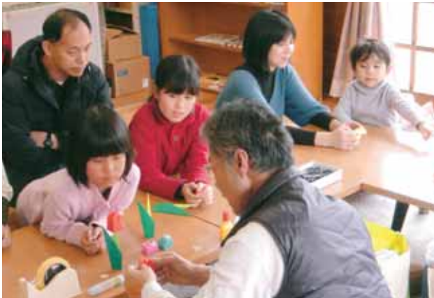
もりの本やさん「折り紙教室」