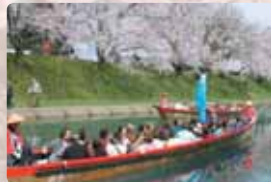
▲(上) ミスのパレード ▼(下) 風情ある桜観覧船