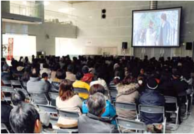
みんなで観よう! 「恋するキムチ」