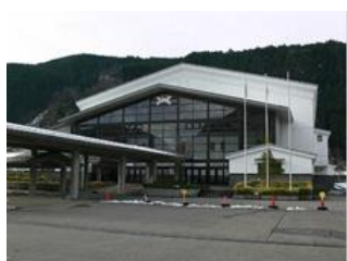
【利用状況】《体育館利用割合が高いため参考》

施設は、体育館とトレーニングジム、会議室で構成し、体育館ではステージと可動式の観覧席（300 席）を活用して市民が舞台発表（年間 12 回）やギャラリー展示を行っていますが、基本的にはスポーツ団体の定期利用や大会などで貸館として利用されています。指定管理者は、市の指定事業としてトレーニングジムの運営等を実施し、自主事業として健康増進のプログラムやスポーツ大会などを行っています。スポーツ利用も含めて年間の利用者数は約 7,000 人で、各部屋の稼働率は以下のとおりです。