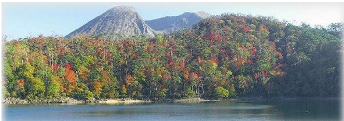
▲ 六観音池の紅葉と韓国岳。(第6回霧島市誕生記念登山大会 池巡りコース) 秋は、対岸の紅葉が湖面に映りとっても綺麗です。

刻々と深まる秋。この時期の行楽といえば紅葉狩り。えびの高原(標高1200m)は、例年10月の終わり頃よりもみじがはじまります。11月最初の連休頃、六観音御池など紅葉の名所を中心にピークを迎えます。現在、えびの高原の池巡り景勝路コースは、新燃岳噴火の影響も無く周ることができます。霧島山の紅葉が終わると11月中旬から下旬には、塩浸温泉龍馬公園周辺の新川渓谷や霧島神宮周辺も見事な紅葉を見せてくれます。霧島の秋を堪能してみたいはいかがでしょう。