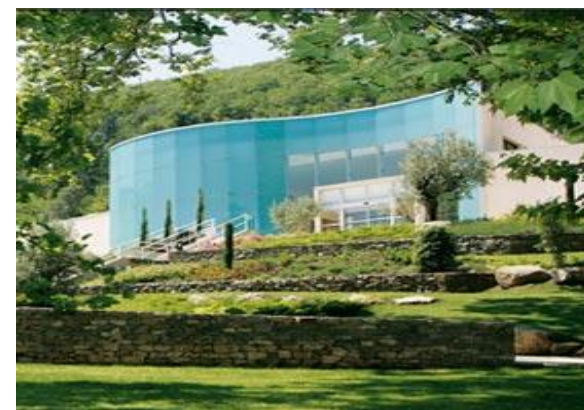
▲ フランスのAvene 水治療センター

世界中、温泉はどこにでも存在し、日本と同じく海外でも古くから湯治が行われています。特にフランスは温泉を用いた病気治療が盛んな国で、国内に100ヶ所を超える温泉保養地があります。その多くで専門医を配置した温泉病院や医療施設が併設されています。このようにフランスは温泉を科学的に捉えてこの治療法を推進しています。