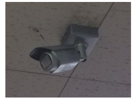
〈監視カメライメージ〉