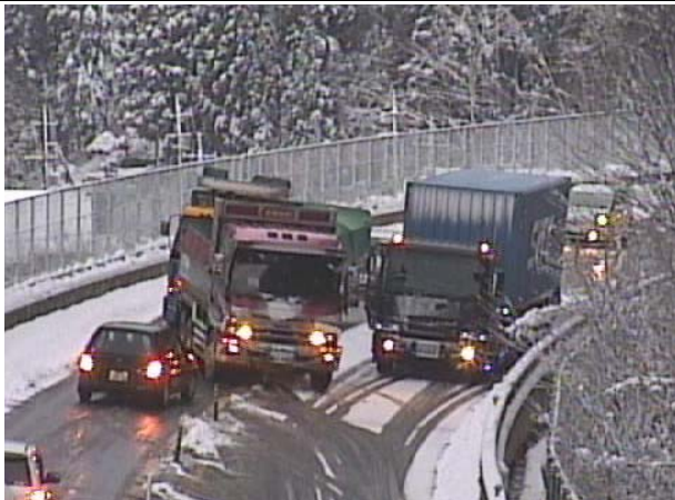
路面凍結により止まっている車両(※他路線の事例)

冬の東広島・呉自動車道を走行される際は冬用タイヤを装着の上、安全運転をお願いします。