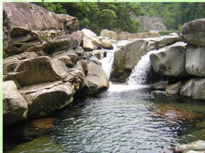
日本屈指の美しい溪流 魚飛溪