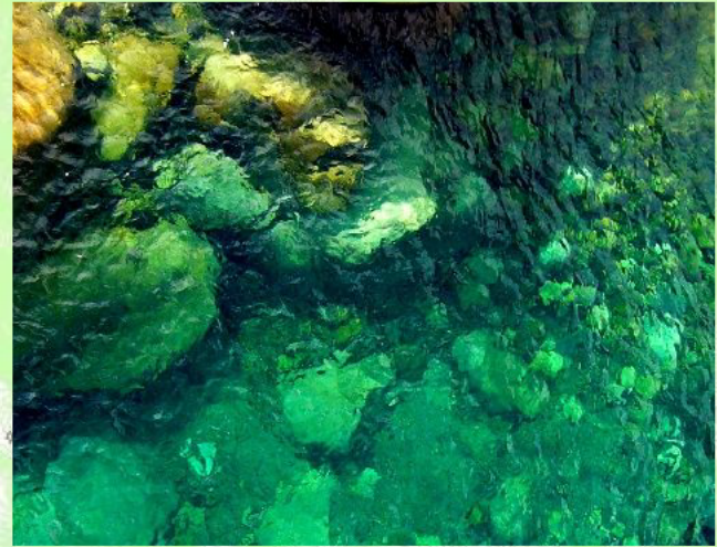
透き通ったエメラルドブルーの水