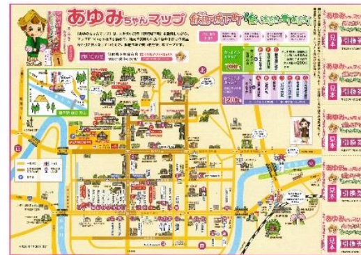
食べあるきまちあるきMAP

(一財)飢肥城下町保存会が中心となり、飢肥城下町周辺の店舗と連携をし、地元特産の食べ物や手作り商品と引き替えしながら、飢肥の施設や町並みを楽しんでもらう食べあるき・まちあるき事業に取り組んでいる。