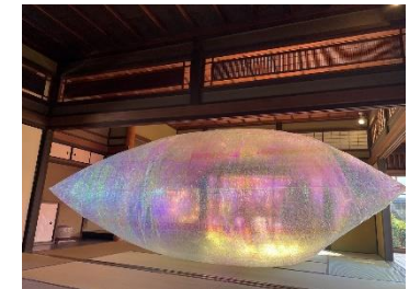
文化財を活用した現代アートの展示