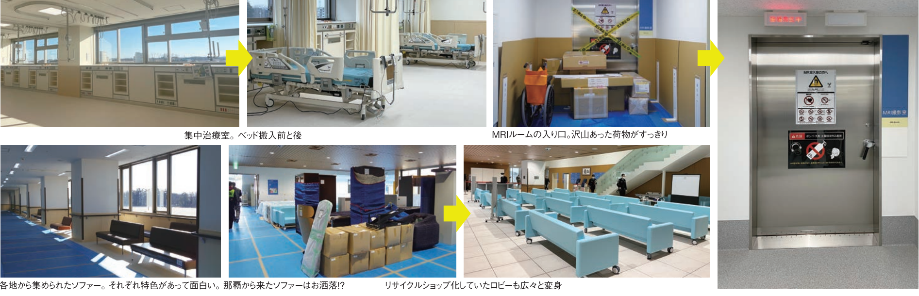
各地から集められたソファ。それぞれ特色があって面白い。那覇から来たソファはお洒落？ リサイクルショップ化していたロビーも広々と変身

自衛隊入間病院の3種の神器は、胸部臓器や骨格などを診るCTスキャン、脳や関節などを診るMRI、そして血管造影をするアンギオ検査機器だ。写真はアンギオ検査機器納入の一部始終。