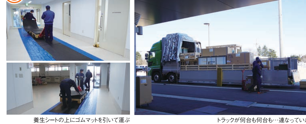
養生シートの上にゴムマットを引いて運ぶ