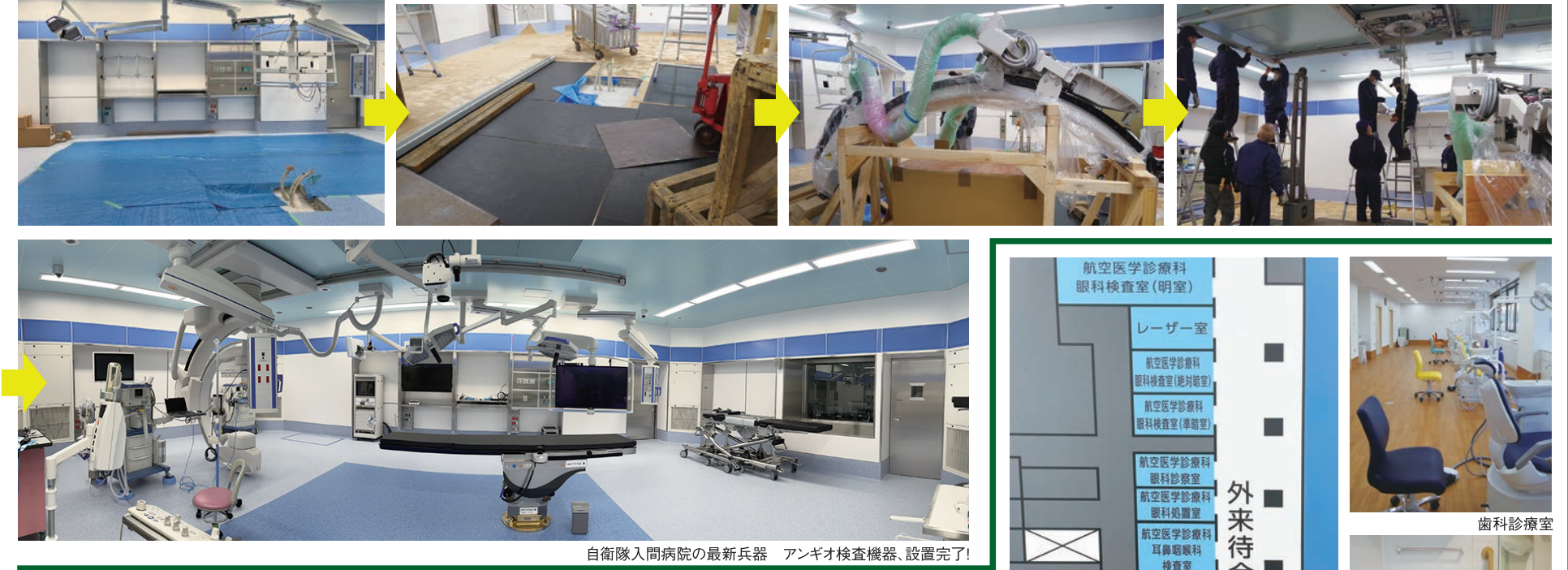
自衛隊入間病院の最新兵器 アンギオ検査機器、設置完了！

自衛隊入間病院の3種の神器は、胸部臓器や骨格などを診るCTスキャン、脳や関節などを診るMRI、そして血管造影をするアンギオ検査機器だ。写真はアンギオ検査機器納入の一部始終。