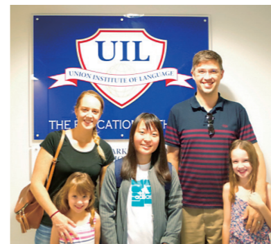
留学は初心者から帰国子女まで対応できる多彩なプログラムを用意しています。