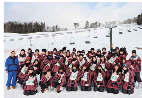
1年次の宿泊研修はスキー実習！学級集合写真

サッカー部、バスケ部、バレーボール部、軟式野球部、卓球部、陸上競技部、eスポーツ部、軽音学部、ほか